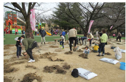
ボランティア作業（施肥）