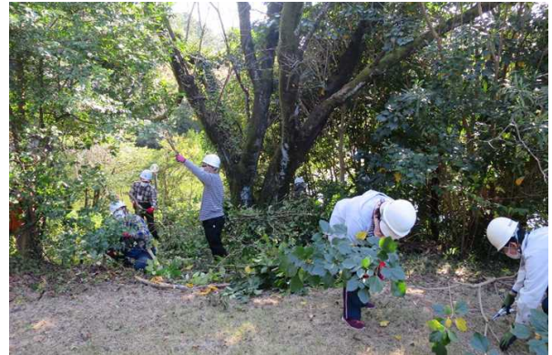
日当り確保、景観の支障木伐採