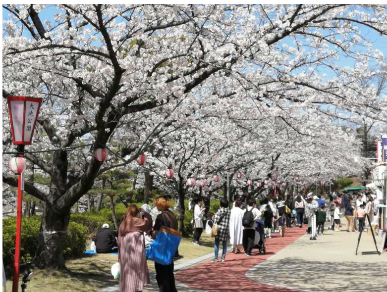
大池公園桜まつりのにぎわいの様子（令和5年春）