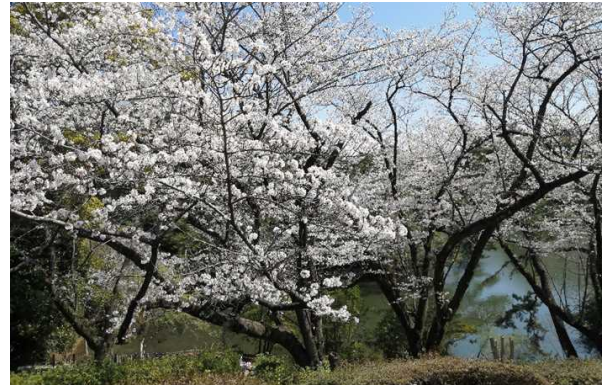
（作業後）明るくなり、桜がのびのびと開花した