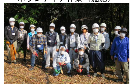
ボランティアの皆さん