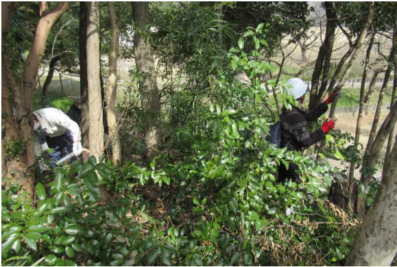
日当り確保、景観の支障木伐採