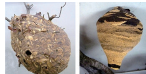
スズメバチの巣 ・マーブル模様 ・球体