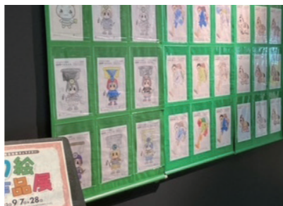
▲平洲先生のぬり絵作品展の様子