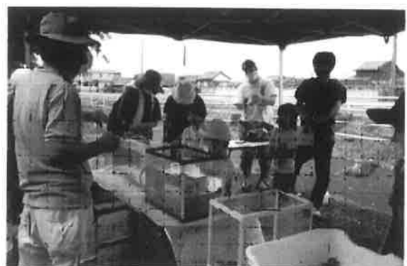
【右】 捕れた川の生物を説明しています