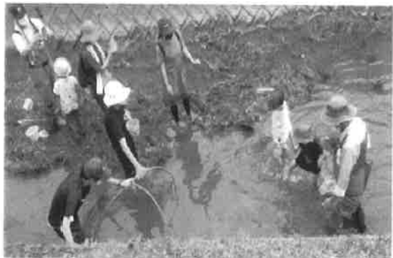
【右】 獲物を求めて川での観察風景