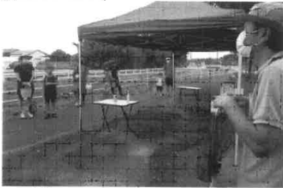
【左】 観察会についての注意事項と挨拶 景