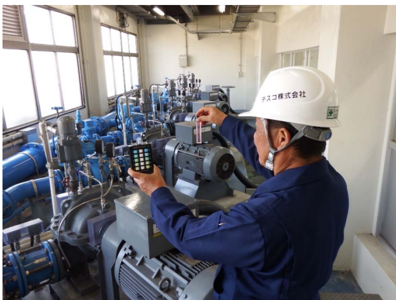
検査状況（上野ポンプ場）

平成31年度より、各ポンプ場の管理運転等を第三者に委託しているため、毎日検査については、委託先であるテスコ株式会社が検査を行います。