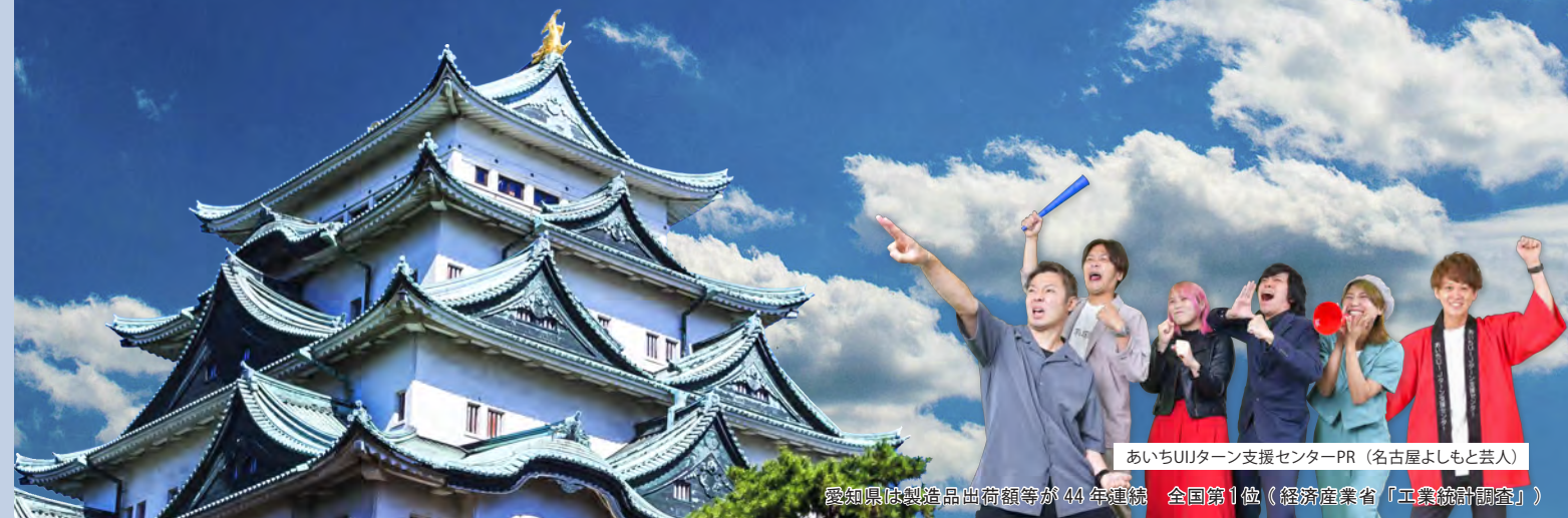
あいちUIJターン支援センターPR (名古屋よしもと芸人)