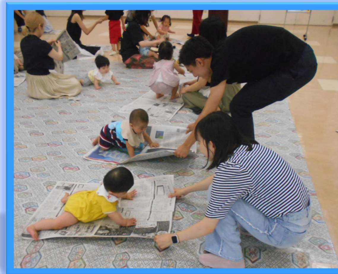
★R7年6月わくわく交流会にて