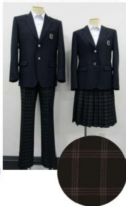
タイプC:歴史や文化を表現した伝統スタイル