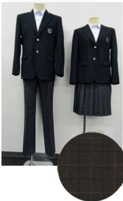
タイプB:フレッシュな王道スタイル