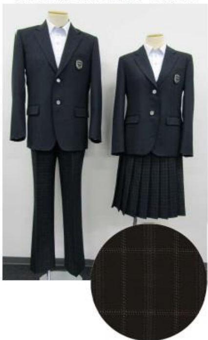
タイプA:スタイリッシュなスマートスタイル