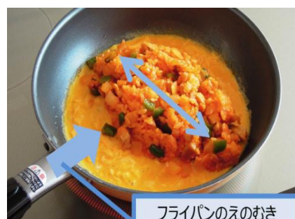
フライパンのえのむき

フライパンが温まったら、卵をフライパンに一気に 流し込み、フライパンをゆり動かしながら、すぐに 菜箸で大きく卵をぐるぐるまぜる。