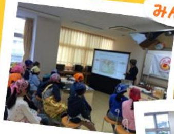
1. 講義 (バランスの良い食事)