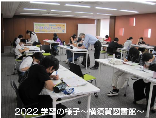
2022 学習の様子～横須賀図書館～