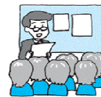
指定された会場へ、講師を派遣