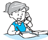
学習希望日の3週間前までに社会教育課 又は申込先へ申請書を提出 (問い合わせは電話でも結構です)