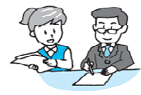
受付後、承諾書の交付 派遣講師と打ち合わせ