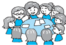
10人以上のグループ

この講座は、市の職員などが皆さんの所へ出向き、身近な市の行政内容などを説明し、一人でも多くのかたにまちづくりに参加していただこうと開催するものです。お気軽にお申し込みください。なお、講座メニュー及び申し込み方法は次のとおりです。