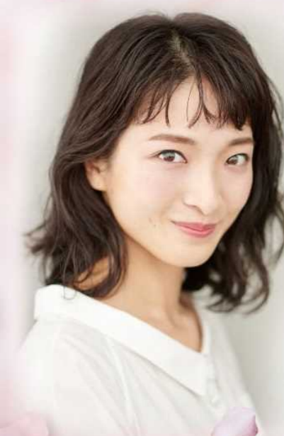
女優 野々 すみ花

元宝塚歌劇団花組男役。 東海市ふるさと大使。 舞台、トークショーやコンサート等 多岐にわたり活動中。