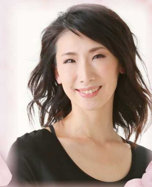
東海市らの花大使 春風 弥里

元宝塚歌劇団花組男役。 東海市ふるさと大使。 舞台、トークショーやコンサート等 多岐にわたり活動中。