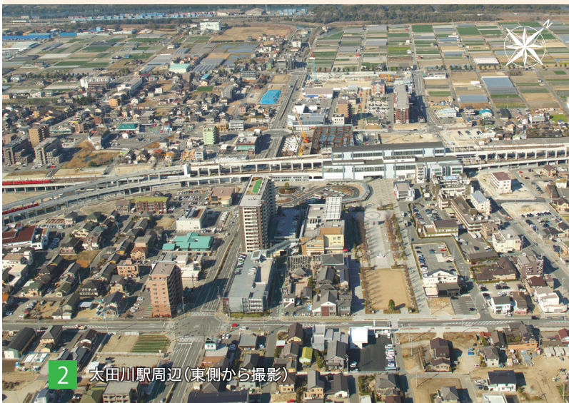
2 太田川駅周辺(東側から撮影)