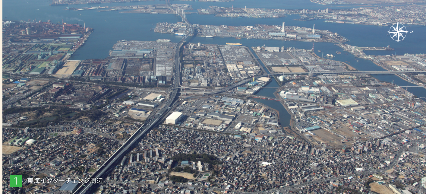
1 東海インターチェンジ周辺