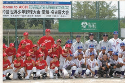
平成20年7月 世界少年野球大会開催