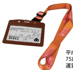
平成28年8月 75歳以上の方のららんバス 運賃無料化開始