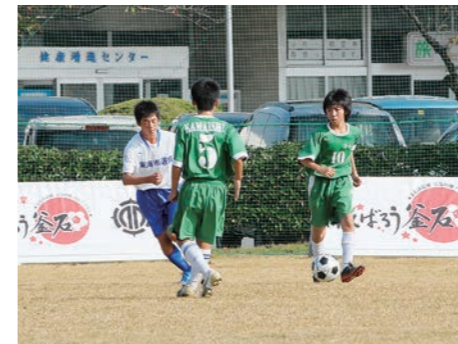
平成23年11月 釜石市との震災後初めてのスポーツ交流開催