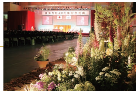
平成21年5月 市制40周年記念式典