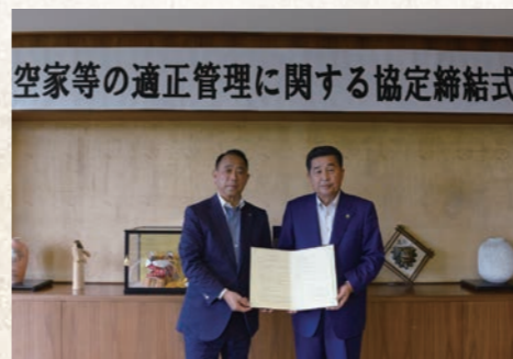
平成29年9月 空家等の適正管理に関する協定締結