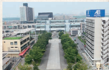
平成30年9月 ホテル等の誘致に関する条例の 認定を受けた第1号ホテルが開業