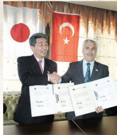
平成19年5月 ニルフェル区と姉妹都市提携