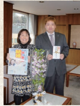
平成24年1月 結婚祝い金支給制度1号誕生