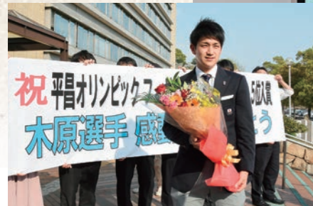
平成30年2月 木原龍一氏平昌オリンピック出場