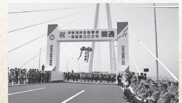
平成10年3月 伊勢湾岸自動車道・一般国道302号開通