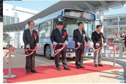
平成24年3月 新循環バス運行開始