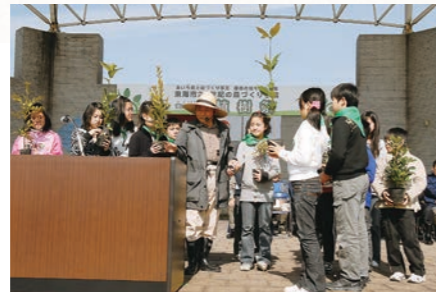
平成21年2月 養父新田緑地植樹祭開催