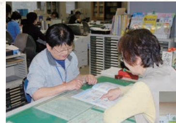
平成24年4月 高齢者支援ネットワークセンター開設