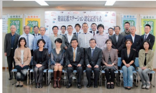
平成24年10月 健康応援ステーションスタート