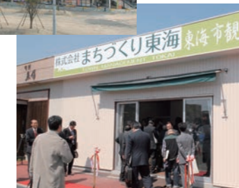
平成23年4月 株式会社まちづくり東海設立