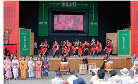
平成17年8月 愛知万博「東海市の日」