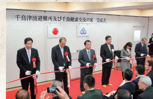
平成27年3月 千鳥津波避難所及び千鳥健康交流の家開設