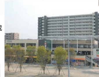
平成23年4月 太田川駅東側に市民交流プラザ・公共駐車場完成