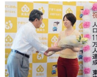
平成23年7月 人口11万人達成