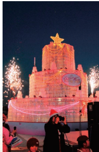
平成24年12月 スイートウィンターイルミネーションin太田川2012開催