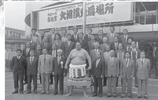
平成11年4月 大相撲東海場所