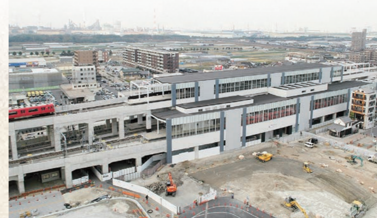
平成23年12月 太田川駅周辺鉄道高架化完成