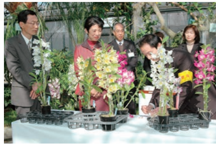
平成21年3月 高円宮妃殿下の農業センター視察