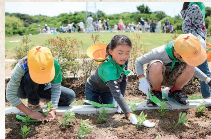
平成29年6月 廻間公園にフジバカマ植栽