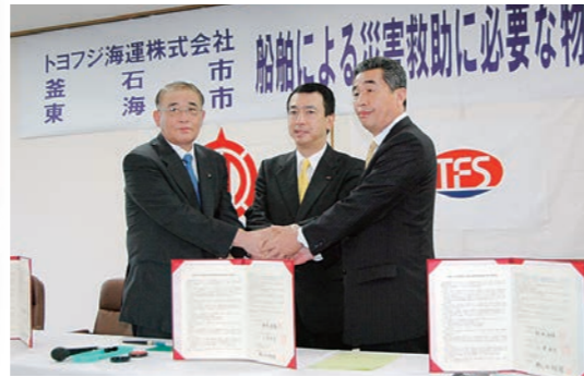
平成18年6月 トヨフジ海運(株)・釜石市・東海市で救援物資海上輸送調印