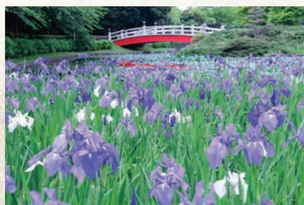
平成28年11月 第36回緑の都市賞(緑のまちづくり部門)において 部門最上位の国土交通大臣賞受賞