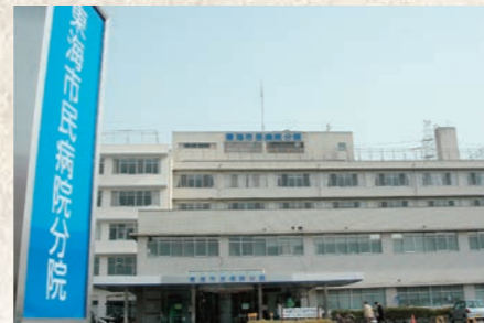
平成20年4月 東海市民病院と産業医療団中央病院 が統合して東海市民病院分院開院