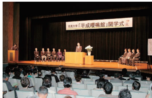
平成18年10月 市民大学「平成囀鳴館」開学