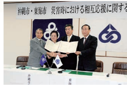
平成20年11月 沖縄市と災害時における相互応援に関する協定締結