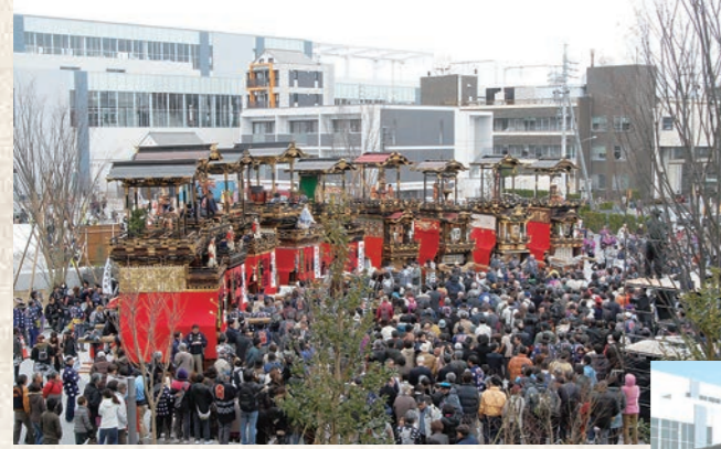
平成24年3月 太田川駅前まち開きフェスティバル開催