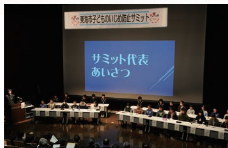
平成28年4月 東海市子どものいじめ防止条例策定