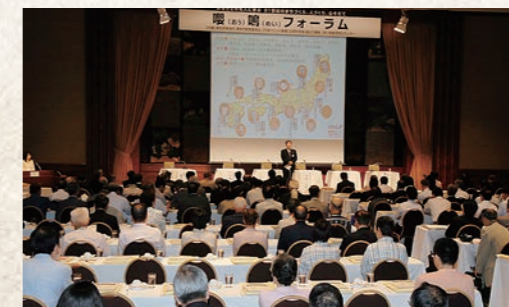
平成19年7月 嬰鳴フォーラム初開催