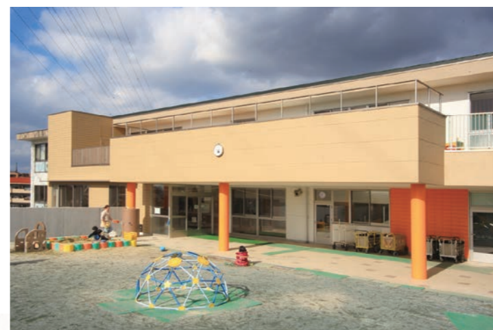
平成29年7月 児童発達支援センター開所