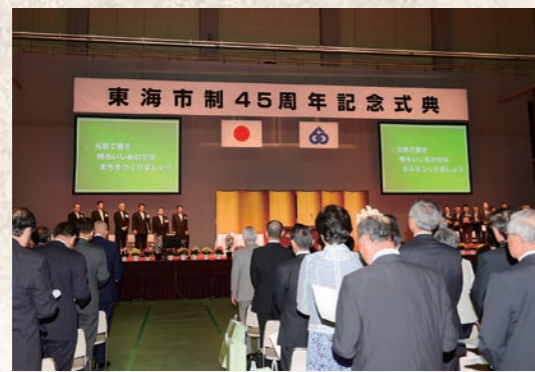
平成26年5月 市制45周年記念式典