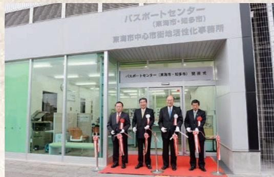
平成28年4月 パスポートセンター開設