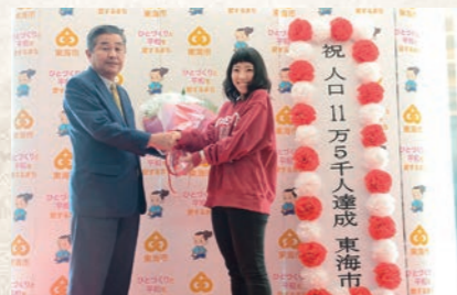
平成30年11月 人口11万5000人達成