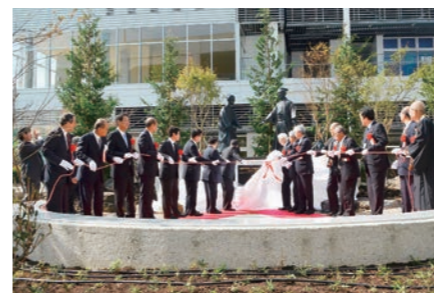
平成27年10月 東海市芸術劇場開館