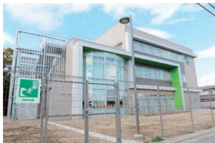
平成30年4月 養父児童館・養父健康交流の家(養父地区津波避難施設) 開所