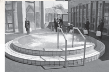
平成9年4月 しあわせ村オープン