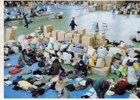
平成23年3月 東日本大震災時救援物資輸送