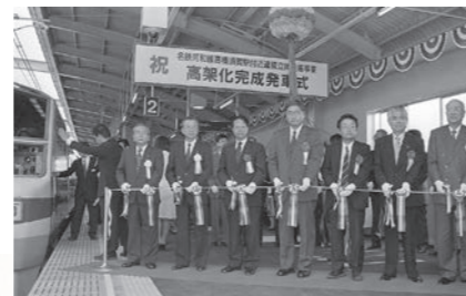
平成12年5月 名鉄河和線高横須賀駅付近の高架化完成