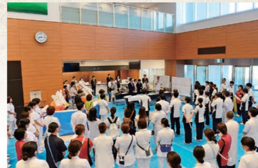
平成27年5月 公立西知多総合病院開院