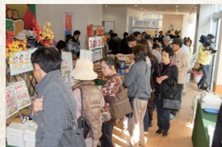
平成24年11月 観光物産プラザオープン