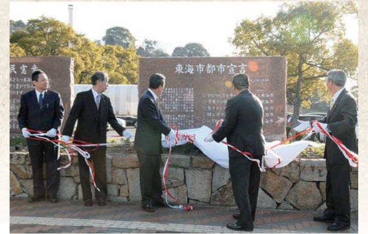
平成23年1月 東海市都市宣言モニュメント除幕式