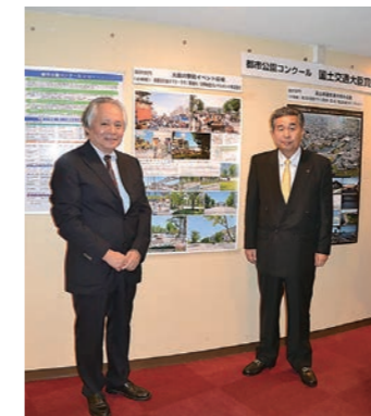
平成25年10月 太田川駅前イベント広場(どんでん広場)が 都市公園コンクールで国土交通大臣賞受賞