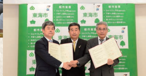
平成26年10月 (公財)名古屋フィルハーモニー交響楽団・ (株)よしもとクリエイティブ・エージェンシーと 東海市ひとつくりパートナーシップ協定締結

東 海 市・公益財団法人名古屋フィルハーモニー交響楽団・株式会社よしもとクリエイティブ・エージェンシー