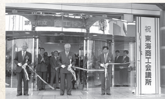
平成10年4月 東海商工会議所設立