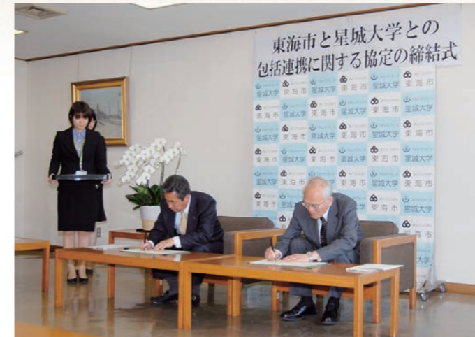
平成25年5月 星城大学と包括連携に関する協定締結