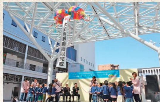
平成28年3月 太田川駅前施設完成式典開催