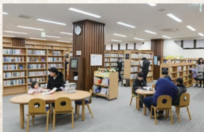
平成30年12月 横須賀図書館完成 (まなぶん横須賀1・4階に開館)