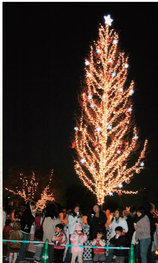
平成18年11月 イルミネーション&クリスマスコンサート開始