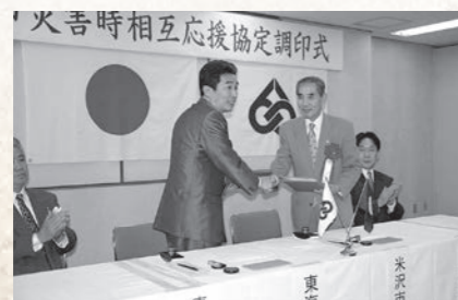
平成13年11月 米沢市と災害時相互応援協定締結