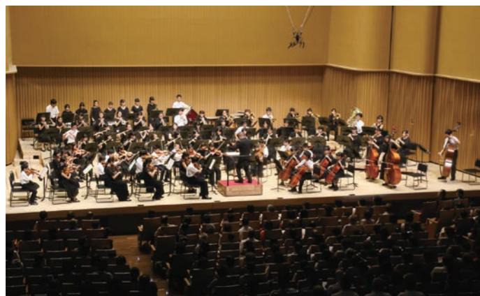
平成30年8月 東海市子どものオーケストラお披露目発表会開催