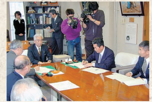
平成15年2月 岩手県釜石市と災害時相互応援協定締結