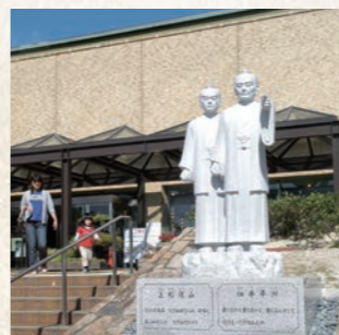
平成19年10月 細井平洲先生・上杉鷹山公石像設置