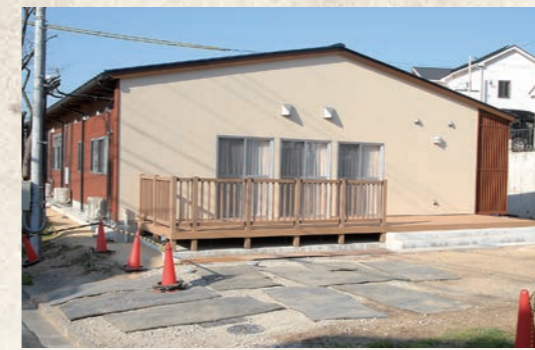
平成25年3月 大池健康交流の家・大池集会所完成