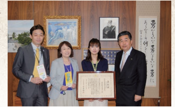
平成25年3月 いきいき元気推進事業が厚生労働省健康局長優良賞受賞