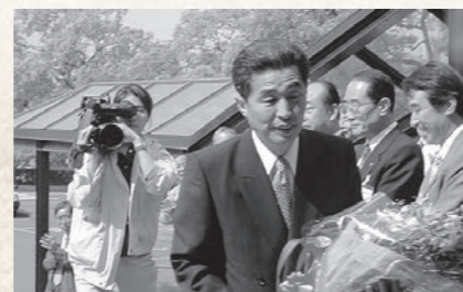
平成13年5月 鈴木淳雄市長初登庁