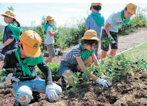
平成28年9月 加木屋緑地にフジバカマ植栽