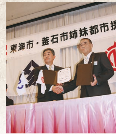
平成19年3月 釜石市と姉妹都市提携