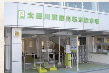
平成24年10月 太田川駅高架下の自転車等駐車場完成