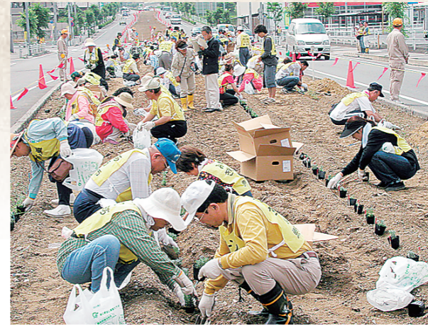
平成15年6月 フラワーロード事業実施