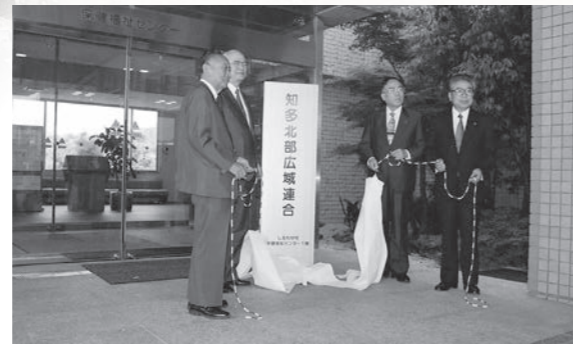
平成11年6月 知多北部広域連合設立