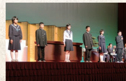
平成16年5月 市制35周年記念式典