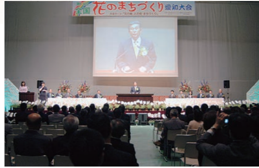
平成17年5月 全国花のまちづくり愛知大会を東海市で開催