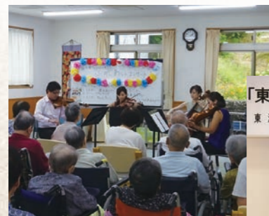
「東海市ひとつくりパートナーシップ協定」締結式

東 海 市・公益財団法人名古屋フィルハーモニー交響楽団・株式会社よしもとクリエイティブ・エージェンシー