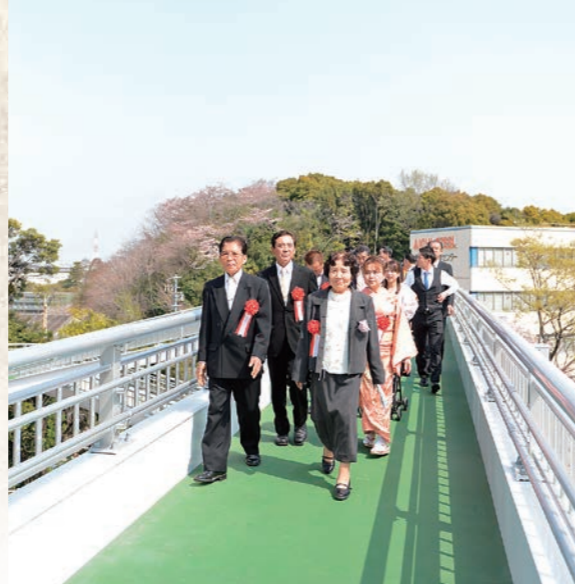
平成30年4月 平洲と大仏を訪ねる花の道連絡橋渡り初め式