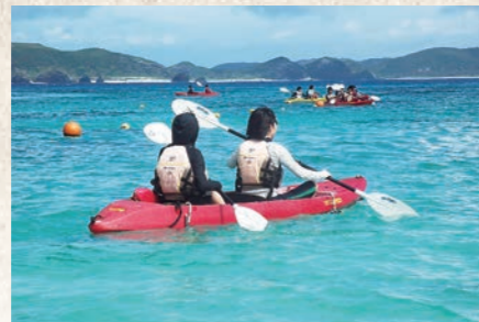
平成20年6月 中学2年生全員を対象に 沖縄体験学習事業開始