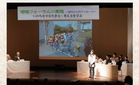
平成23年11月 嬰鳴フォーラムin東海開催