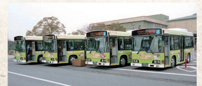
平成16年4月 らんらんバス(循環バス)本格運行開始