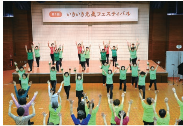
平成26年10月 いきいき元気フェスティバル初開催