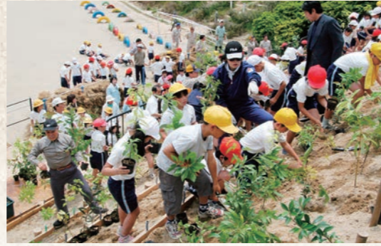
平成17年5月 21世紀の森づくり事業