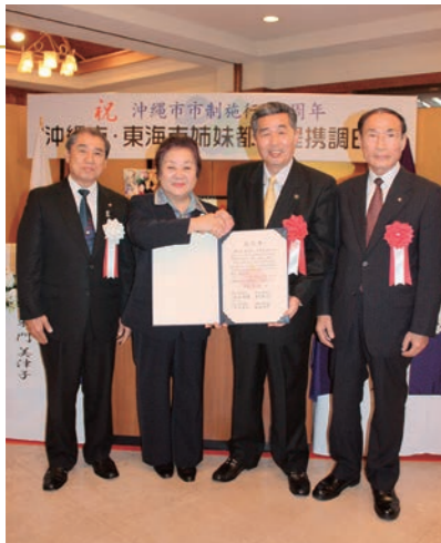
平成21年11月 沖縄市と姉妹都市提携