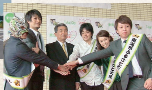
平成22年11月 ふるさと大使就任