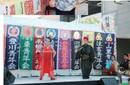
平成29年7月 沖縄フェスティバル初開催