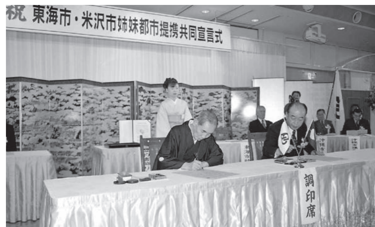
平成12年10月 米沢市と姉妹都市提携