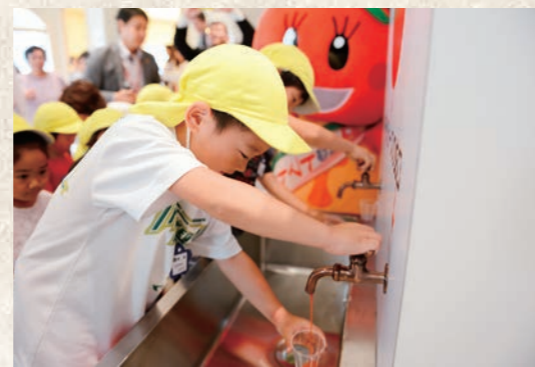
平成26年4月 カゴメ(株)とトマトde健康まちづくり協定締結後、 寄贈された「トマトジュースがでる「蛇口」」