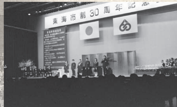
平成11年5月 市制30周年記念式典