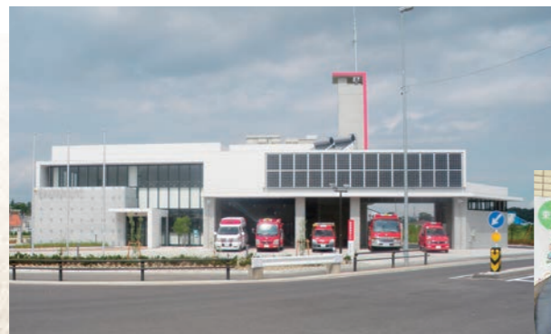
平成22年10月 地域防災センター開設