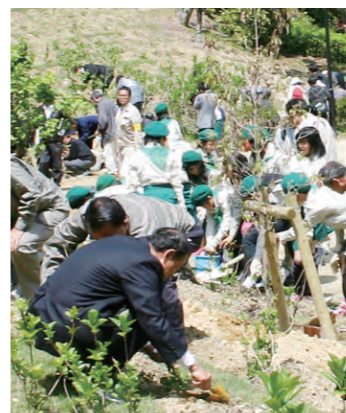
●公園の緑化活動 親しみやすく特徴ある公園を目指して、公園の緑化活動を行なっています。

緑を増やすために行なっているのが「21世紀の森づくり」事業。子どもから大人まで参加する植樹祭により、公園に花や緑が増え、新しい緑地もどんどん広がっています。市民の皆さんが自分たちの手で苗を植えるので、「公園への親しみが湧いた」という声も。また、自然あふれる里山を活用した緑地の整備も、加木屋地区で行なっています。次の世代へ