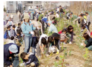
●21世紀の森づくり 平成16年度開始のこの事業では今年までに7か所で植樹祭を実施しました。

緑を増やすために行なっているのが「21世紀の森づくり」事業。子どもから大人まで参加する植樹祭により、公園に花や緑が増え、新しい緑地もどんどん広がっています。市民の皆さんが自分たちの手で苗を植えるので、「公園への親しみが湧いた」という声も。また、自然あふれる里山を活用した緑地の整備も、加木屋地区で行なっています。次の世代へ