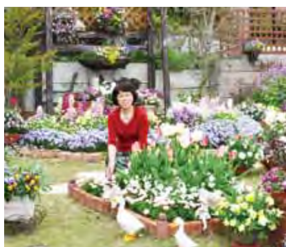
●花壇コンクール(受賞花壇) 「花と緑いっぱい運動」に取り組んでいる東海市では、毎年春と秋の2回、花壇コンクールが開催されています。

●仲間や家族と出かけたい 花とみどりあふれる公園 東海市の自慢のひとつは、大きな公園 がいくつもあること。市の発足当時から 公園整備に力を入れており、現在は市内 に大小64もの公園が点在。今後もさらに 整備が進められていく予定です。 市外からも多くの人を訪れる大池公 園、聚楽園公園は、まちを代表する人気 の公園。ほかにも、乗り物遊びが楽しめ る公園、日本庭園のある公園、花の名所 として知られる公園など、個性豊かな 公園がそろっています。