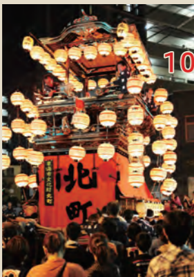
●尾張横須賀まつり 横須賀町の愛宕神社の祭礼。4台の山車がまちを練り歩きます。