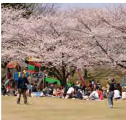
●大池公園の桜 大きな池の周りに広がる市内最大の公園。まち一番の 桜の名所としても知られています。