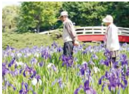
●上野台公園のカキツバタ 落ち着いた日本庭園が楽しめる公園。5月下旬に咲く カキツバタを見に大勢の人が訪れます。