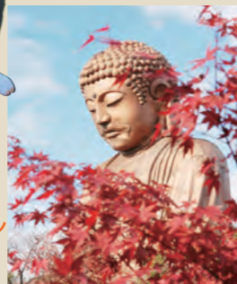
●聚楽園公園もみじまつり 知多半島きっての紅葉の名所に、7種類約550本のもみじが色づきます。

●猩々メッタ 名和地区の伝統祭礼。ユーモラスな大人形が祭囃子に乗ってまちを歩きます。