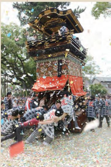
●大田まつり 大田町の大宮神社の祭礼。4台の山車が登場し、迫力満点です。