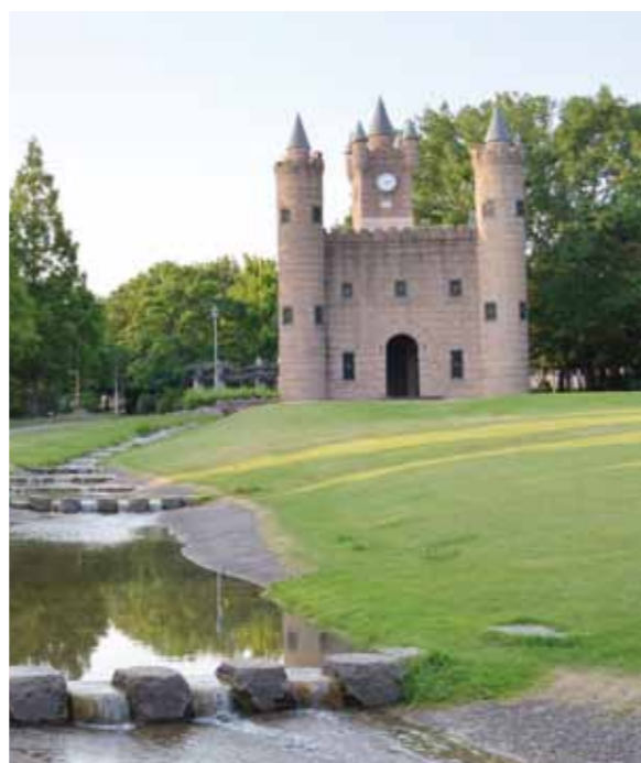
●加家公園(メルヘンの森) 中世のお城があるおとぎの国のような公園。子どもや家族連れ に人気です。