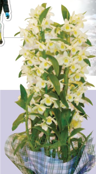
●東海市オリジナル洋ラン「平州」 Nicknamed the "town of tropical orchids", the City of Tokai is known as one of Japan's largest producers of Western orchids.

東海市では、昭和初期から洋ランの生産が本格化し、現在は日本有数の産地となっています。農業センターでは、生産農家と協力してオリジナル品種の開発を行なっています。