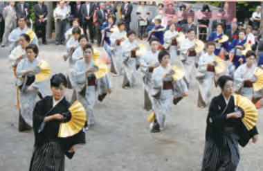
●平洲祭 細井平洲をしのいで開催されます。民謡や和太鼓演奏が会場を盛り上げます。