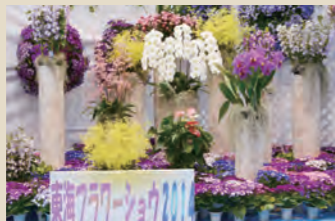
●東海フラワーショウ ランのまち東海市の花と緑の祭典。展示会、即売会、園芸教室が実施されます。