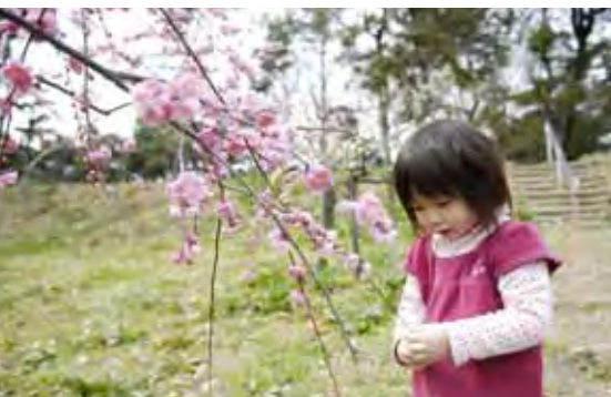
●大池公園の梅 公園の丘の斜面には梅林があります。かわいらし い梅の花がひと足早い春の訪れを告げます。