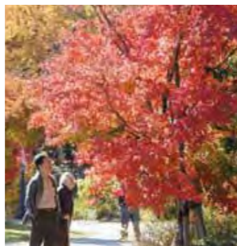
●聚楽園公園の紅葉 秋の紅葉は特に見事で、毎年もみじまつり が開催されます。

●仲間や家族と出かけたい 花とみどりあふれる公園 東海市の自慢のひとつは、大きな公園 がいくつもあること。市の発足当時から 公園整備に力を入れており、現在は市内 に大小64もの公園が点在。今後もさらに 整備が進められていく予定です。 市外からも多くの人を訪れる大池公 園、聚楽園公園は、まちを代表する人気 の公園。ほかにも、乗り物遊びが楽しめ る公園、日本庭園のある公園、花の名所 として知られる公園など、個性豊かな 公園がそろっています。