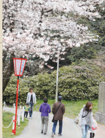
●大池公園桜まつり 7種類約1,100本の桜があり、公園全体が桜に包まれます。夜間ライトアップも実施。