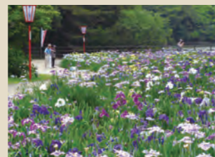
●大池公園花しょうぶまつり 地形を生かした花しょうぶ園に、128種類約8,000株が咲き誇ります。