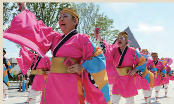
●にっぽんど真ん中祭り 太田川駅前会場 名古屋の夏の祭典「どまつり」の会場が東海市にも設置。熱い踊りが繰り広げられます。