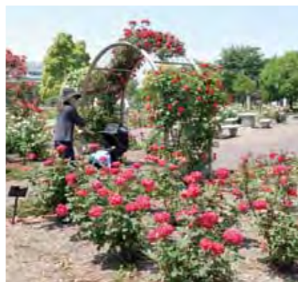
●元浜公園のバラ 水がテーマの大きな公園。5月になると色とりどりの バラが目を楽しませてくれます。