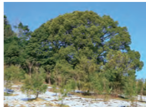
●加木屋緑地 自然林などが残された場所を次世代へ継承するため、整備を続けています。