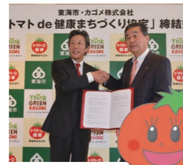
とまていーぬ トマトde健康プロジェクト 事業の啓発キャラクター