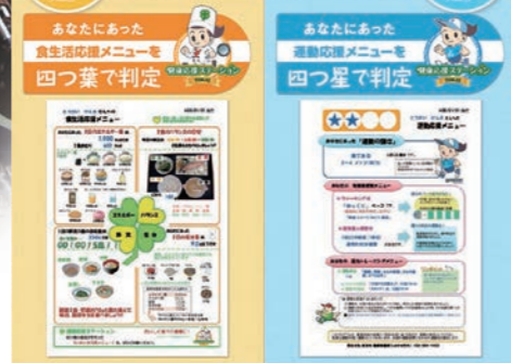
応援メニューの一例

「四つ葉」で判定し、「エネルギー(カロリー)量」「食のバランスの目安」などが分かるあなたに合った食生活メニューです。