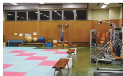
市民体育館トレーニング室