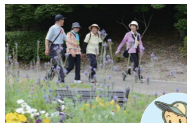
5回参加すると「へいしゅうくんオリジナルピンバッジ」がもらえます

「出前講座」 企業への出前講座 保健師や管理栄養士などを派遣し、従業員に食生活応援メニューや運動応援メニューを提供しています。