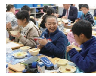
トマト給食 市内の保育園、小・中学校で トマトを使った給食を実施