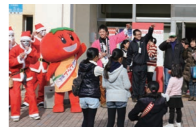
トマトジュースで乾杯