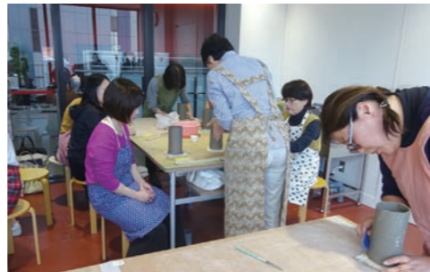
陶芸ワークショップ