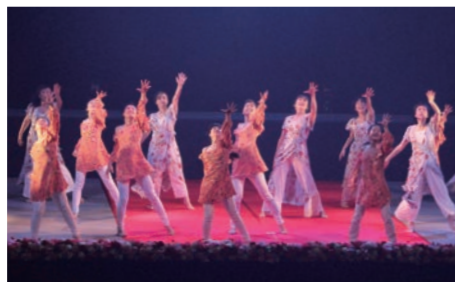
東海市ダンスチーム Miakot

東海市子どものオーケストラ、合唱団やダンスチームなどが技術を磨くだけでなく、豊かな人格とより良く生きていく強い力を育んでいます。 また、芸術劇場自主文化事業の運営をサポートする市民スタッフを組織し、市民が気軽に文化芸術に携わっています。