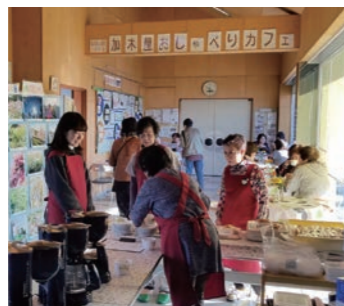
地域サロンカフェ

公民館・市民館の各種講座 乳幼児から高齢者まで幅広い年齢層を対象として、地域の特色に応じた多種多様な講座を開催しています。 館利用者以外の住民も気軽に集え、交流する場を設け、いつでも・だれでも館に集まれ、情報の発信や収集の機会を提供し、ネットワークの構築、地域づくりに寄与でき、また生きがいづくりの発見となることを目指し、地域サロンカフェを実施しています。