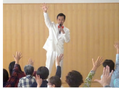
よしもと流楽しいコミュニケーション

優れた文化芸術を鑑賞する機会を提供し、文化芸術への意識の高揚を図るために、劇場内だけでなく市内の保育園、学校や福祉施設などにおいて文化芸術にふれる活動を行っています。 また、(公財)名古屋フィルハーモニー交響楽団、よしもとクリエイティブ・エージェンシーと「東海市ひとづくりパートナーシップ協定」を結び、文化芸術活動とおして、ひとづくりと地域活性化に取り組んでいます。