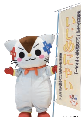
いじめ防止キャラクター いじめにやい

市内各校でいじめ防止に取り組む、いじめに対する意識調査の実施や分析、啓発活動や全小中学生による「いじめ防止宣言」の作成などを実現しました。