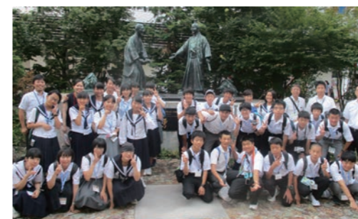
米沢市／対面の像前

市民大学「平成 ちやうめい 鳴鳴館」 市民主導の学習の場と機会を広げるため、市民が教員、学生、運営者として市民大学「平成 ちやうめい 鳴鳴館」に参加しています。 「学び・教え活かし合う輪を広げよう」をスローガンに、10代から90代まで2千900人以上の学生が語学、音楽、健康、料理などおよそ200講座を受講しています。