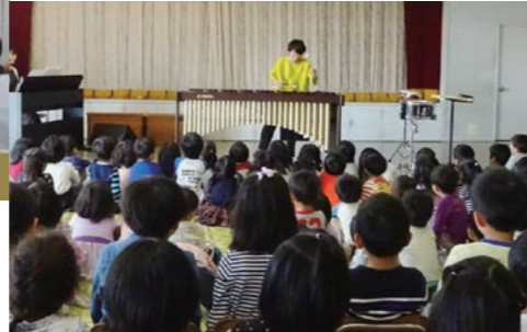
おんがくさんはじめてコンサート