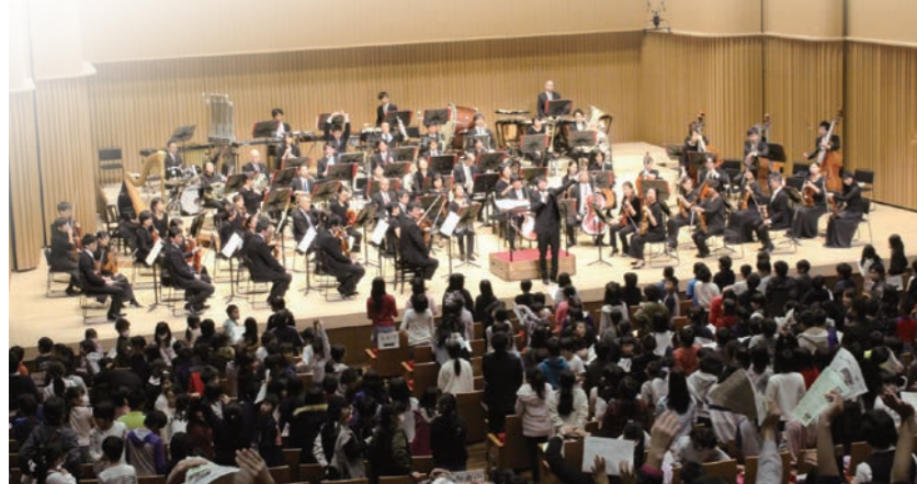
劇場招待コンサート