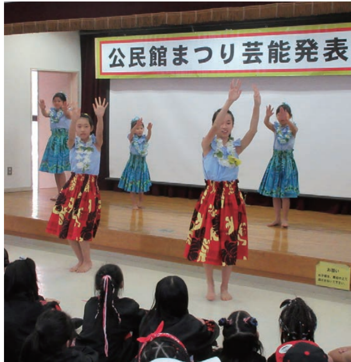
公民館まつり芸能発表

「生涯学習」 高齢者や、子育て中の家庭などを対象とした教室や講座の実施など、人と地域との共生を目指した事業を推進しています。 地区公民館・市民館まつり 公民館・市民館まつりは、文化・学習活動の発表の場や、地域住民の交流の場として、各館において10月～3月にかけて開催しています。