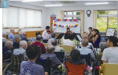
ふれあいコンサート