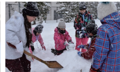
米沢市／雪像づくり

「親善交流」 国内姉妹都市の小中学生がお互いのまちを歩き来し、相互理解と親睦を深めることで生きる力を育みます。