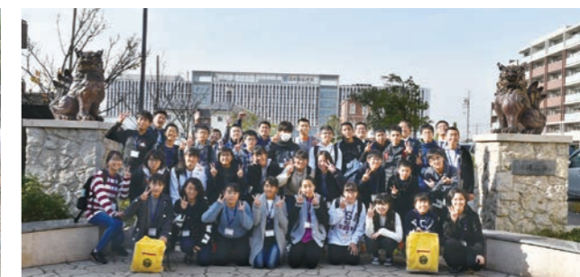
沖縄市／沖縄広場前

「読書支援」 子ども読書活動 本との出会いが、子どもの豊かな心と生きる力を育む糧になることを願い、読書に親しみ、読書の大切さを知ることができるよう、市全体で取り組んでいます。