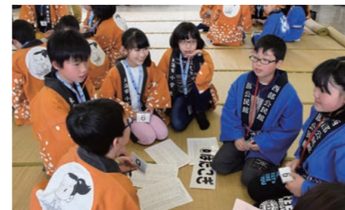
米沢市／雪ん子少年団との交流

公民館・市民館の各種講座 乳幼児から高齢者まで幅広い年齢層を対象として、地域の特色に応じた多種多様な講座を開催しています。 館利用者以外の住民も気軽に集え、交流する場を設け、いつでも・だれでも館に集まれ、情報の発信や収集の機会を提供し、ネットワークの構築、地域づくりに寄与でき、また生きがいづくりの発見となることを目指し、地域サロンカフェを実施しています。