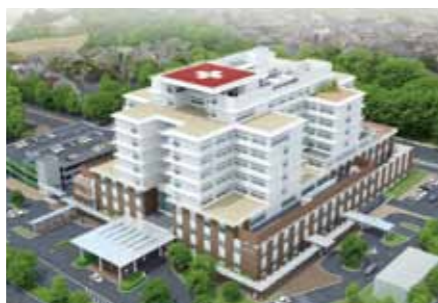
●公立西知多総合病院(完成予想図) 平成27年度のオープンに向けて、現在建設が進められており、新しい医療拠点として期待されています。