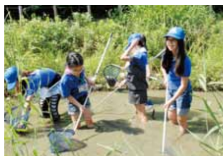
● 輝く学校づくり(船島小学校) 各学校では、それぞれが工夫して地域の特性を生かした教育活動を行い、特色ある学校づくりに取り組んでいます。