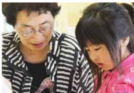
●高齢者とのふれあい 保育園児たちが地域のおじいちゃん、おばあちゃん方から、さまざまなことを学ぶ会が定期的に開催されています。