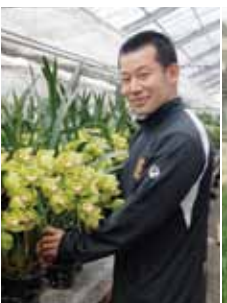
●農業後継者 洋ラン、タマネギ、フキ、ブドウ、ミカン、イチジクなど、愛知県を代表する農産品が市内で作られています。これらを担う若手の農業経営者も育っています。