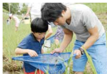
● エコスクール 体験や発見をとらして子どもたちの環境問題への関心を高める取り組みです。さまざまな講座を実施しています。