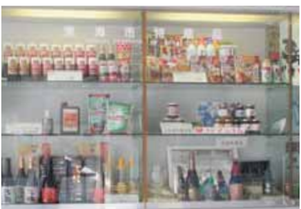
●特産品 食品加工業が盛んで、えびせんべい、きやらぶきなどが生産されています。