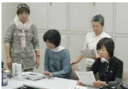
● ボランティア養成 地域で活動するボランティアを養成する講座が開かれており、多くの人々が参加し、活動の場を広げています。