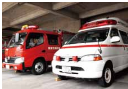
●東海市消防本部 消防及び緊急搬送の拠点で、1本部・1消防署・2出張所、職員120人、消防車26台・救急車4台の体制です。