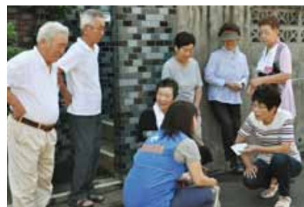
●地域支えあい活動（見守り活動） 地域支えあい活動、高齢者の見守り活動など、地域一体となって暮らしやすいまちづくりに取り組んでいます。

Personal interactions create warm, kind communities. Tokai residents are increasingly becoming involved in interactive activities through volunteerism and events, including Community Support activities for senior citizens. Tokai promotes lively exchange activities with its sister cities at home and abroad, while taking steps to involve its foreign residents as an integral part of its diverse community.