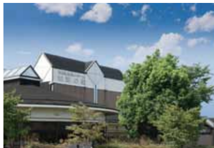
●特別養護老人ホーム 要介護認定を受けた高齢者で、在宅の生活が困難な人のための入所施設です。高齢者・介護者をサポートします。