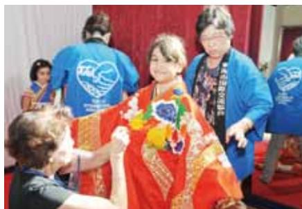
●姉妹都市との交流 国内外のまちと姉妹都市の提携を結んでおり、人材交流やイベントでの交流などが盛んです。