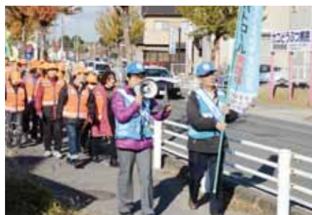
●タカカニ防犯パトロール隊 高横須賀地区の皆さんが結成したパトロール隊です。ほかにも市内では14の防犯ボランティア団体が活躍しています。

Security is a critical aspect of building a more comfortable community, and the City of Tokai takes its anti-crime and other preventative activities seriously with the goal of maintaining safety and avoiding disaster. Specifically, the city has worked with residents to upgrade its utilities, emergency response measures, and crime watch programs. The city also strives to improve and broaden its resident services in medicine, healthcare, and nursing care.