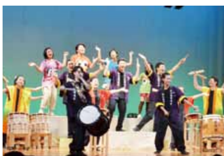
● 囃鳴祭 新しい文化を創造するべく和太鼓・合唱・演劇・踊りの「囃鳴四座」が活動中。囃鳴祭でその成果を発表します。

We know how important it is to energize people with lifelong learning opportunities and enjoyable leisure activities. Tokai City works to enrich the lives of its residents by offering opportunities for senior citizens and persons with disabilities to find jobs and participate in various other meaningful activities. We are always working to improve our educational programs to help children and young citizens grow up healthy and strong.