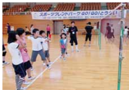
● スポーツフレンドパークGO!GO!とうかい 市民体育館を会場に、だれでも気軽にスポーツが楽しめるイベントです。健康測定、体力測定も実施します。