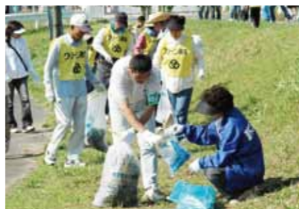
● 清掃活動 ボランティアグループを中心に、地域の皆さんが参加する清掃活動で、美しいまちが保たれています。