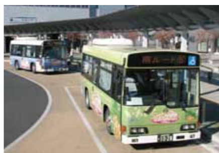
● らんらんバス 主要駅や主要施設を結ぶ循環バスです。1乗車100円で、北・中・南の3ルートが毎日運行されています。