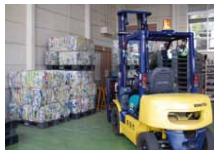
● 清掃センター・リサイクルセンター 市内で回収されたごみは清掃センターに集積されます。リサイクルセンターでは、再生可能資源の中間処理を行います。