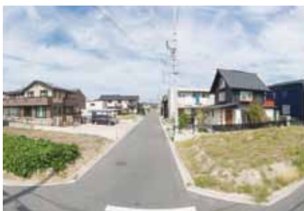
●区画道路や住宅地の整備 太田川駅周辺の土地区画整理事業を始め、より快適で安全に暮らせるよう市内各所でまちの整備を行っています。

Tokai is a dynamic city with a lively industry driven by a diverse community of people. The city is always working to further industrial development and support more robust economic activities—which includes training the next generation of successful leaders. As a part of these initiatives, we are working to redevelop our city center in a balanced way that harmonizes the region's residential areas, agricultural land, commercial districts, and industrial zones.