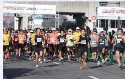
東海 とうかい ハーフマラソン