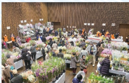
とうかい 東海フラワーショウ