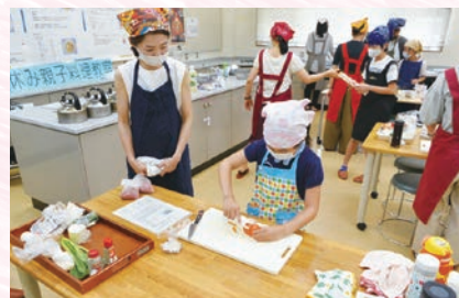
おやこりょうりきょうしつ 親子料理教室