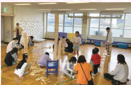
だれでも遊べる地域の遊び場