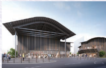
創造 そうぞう の社交 もりこうりゆうかん 交流 ず 館 かん イメージ図