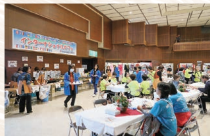
インターナショナルデー (とうかいあき 東海秋まつり)