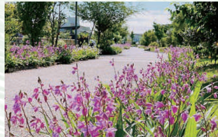
おお お た た が が わ わ え え き き り り が が し し ほ ほ どう どう 太田 おお 川 た 駅 えき 東 とう 歩 ほ 道 みち 「ランの道」