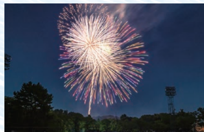
とうかい はなび たいかい 東海まつり花火大会