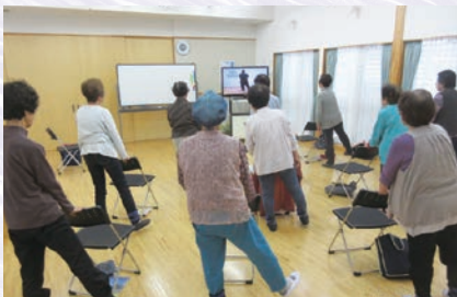
いきいき百歳 ひゃくさいたいそう 体操

みんなの健康 けんこう づくりやスポーツ、芸術 げいじゆつ に関する取 と り組 く みなど。