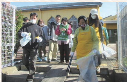
しょう しょう しょうがいこうけんかつどう 障がい者の社会貢献活動