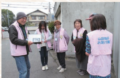
ち いき ささ 地域支えあい活動