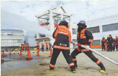
しょうぼうだんほうすい れん 消防 しょうぼう 団 だん 放水 ほうすい 訓練 くんれん

安心して利用 りよう できる道路 どうろ や公園 こうえん 、緊急 きんきゆう の時に使う救急車 きゆうきゆうしゃ や消防車 しょうぼうしゃ に関する取 と り組 く みなど。