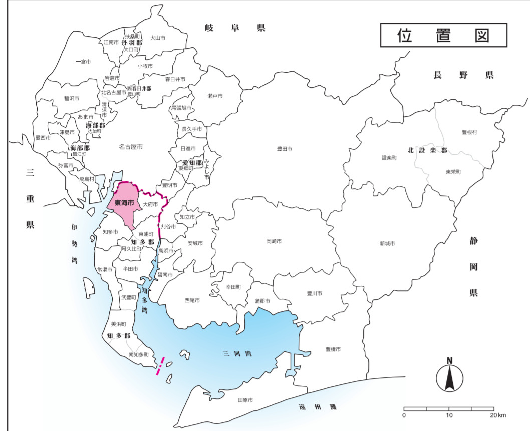
知多都市計画区域 (Chita Urban Planning Area)