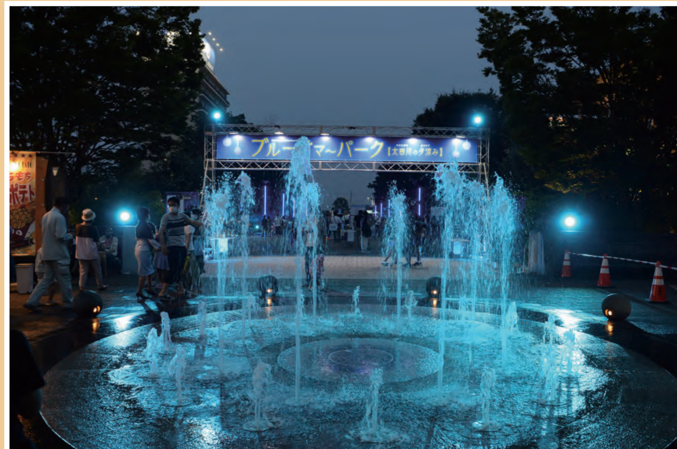
「ブルーサマーパーク太田川の夕涼み」～令和2年8月8日・9日開催 太田川どんでん広場～ 新型コロナウイルス感染症拡大防止による新しい生活様式に対応したイベントを開催しました。青を基調としたライトアップ、大型ビジョンの仮想花火、線香花火など、涼を感じる夏を演出しました。

太田川駅周辺では、東海市の玄関口としてふさわしい中心市街地を整備するため、土地区画整理事業を進めています。現在すべての工事・測量が終わり、引き続き事業完了を目指し、取り組んでまいります。