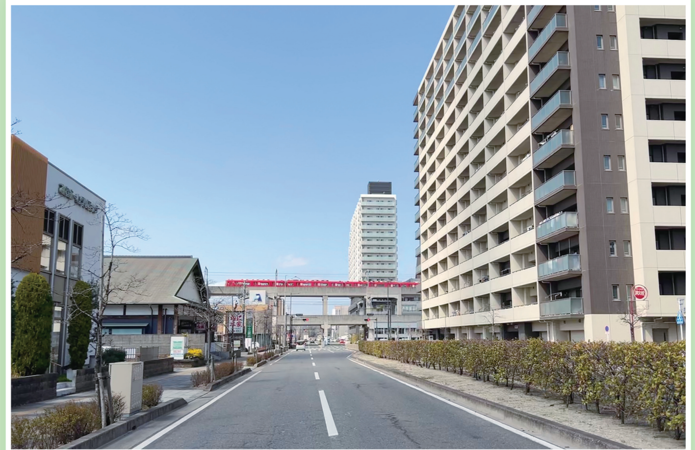
太田川駅周辺のスッキリした姿

無電柱化(電柱を撤去し地上電線類を地中に移設)をしたことで、災害時に道路が寸断される等の危険リスクを減少させることから、災害に強いまちとなりました。また、良好なまちなみ景観が形成され、地域の活性化へとつながります。