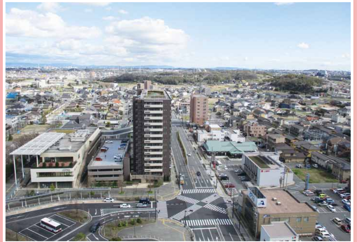
ローレルタワー屋上から東方面 (H30.3撮影)