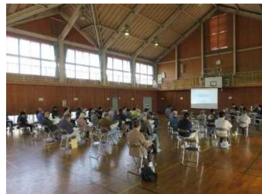
写真：事業計画(案)に関する説明会