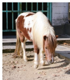
動物舎ではポニーやクジャクがお出迎え。