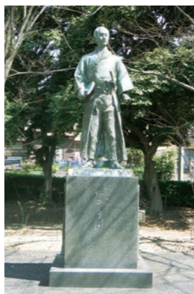
星城大学南側の万葉の広場に立つ若き日の平洲像