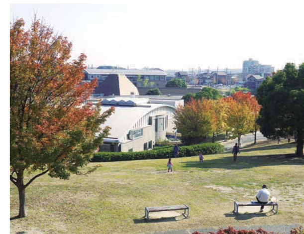
プールやフィットネスジムがある「しあわせ村」では、健康づくりをサポートしています。