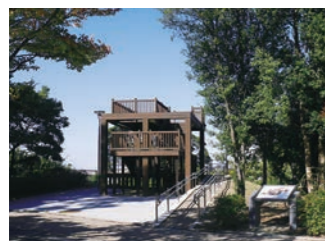
学の広場にある展望台

加家公園は「メルヘンの森」「学の広場」「行の広場」の3つのエリアに分かれており、それぞれ違うコンセプトで整備されています。メルヘンブリッジでつながる大窪公園ではバーベキューをお楽しみいただけます。また、2つの公園にまたがって整備された「ツバキの小径」は1~3月が見頃です。