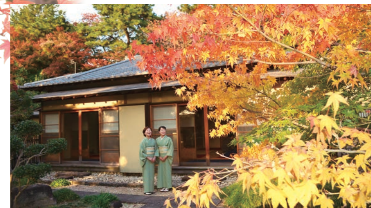
嚶鳴庵 四季折々の庭園を眺める本格茶室で、お抹茶をお楽しみ頂けます。