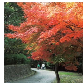
秋にはイロハモミジやヤマモミジなどの紅葉が楽しめます。