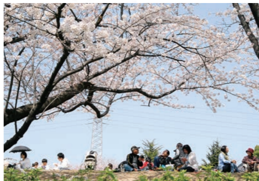
桜まつりには多くの花見客が訪れます。