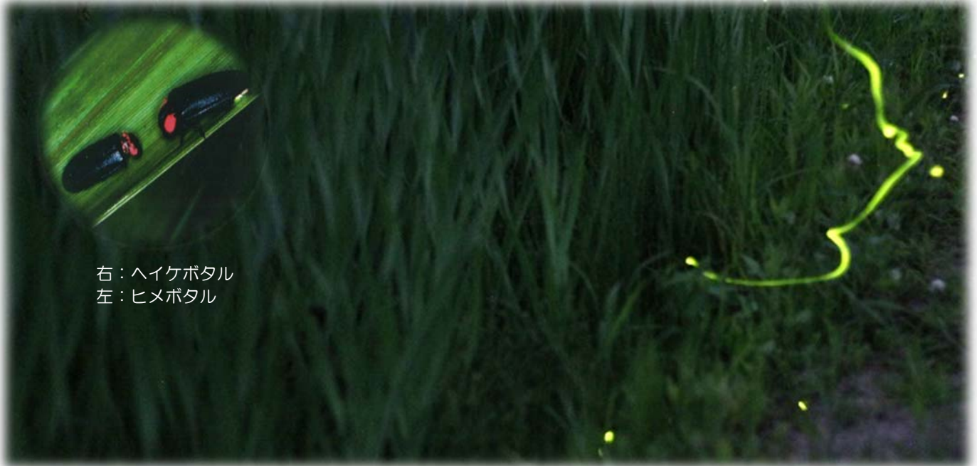
右：ハイケボタル 左：ヒメボタル