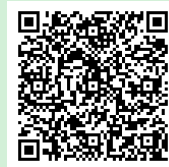
▲ Android 用