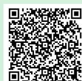
▲ iOS 用

詳しくは、ごみの出し方については清掃センターへ、「東海ナビ」については市役所広報課（3