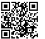
市のワクチン特設サイト