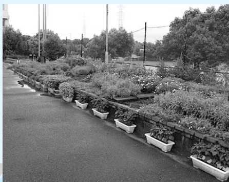
保育園・学校花壇の部 最優秀賞 三ツ池小学校の花壇

天候不順による長雨の中でも、小まめな手入れによって美しさを維持しようという努力の跡も各所に見られ、草花飾りに対する真摯な取組が感じられました。