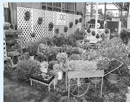
共同花壇の部 最優秀賞 愛知製鋼工機課の花壇