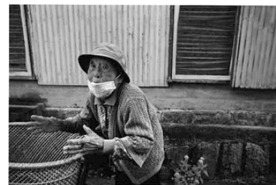
▲「今からモーニングにGo To!」(c)伊藤廣二