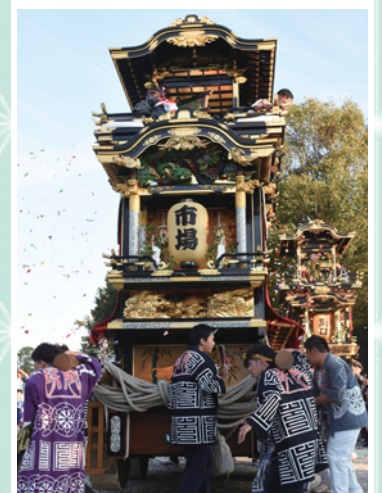
▶大田まつりの様子

尾張横須賀まつり、大田まつりともに江戸時代後期には山車が運行されるようになったといわれています。同時期に周辺地域で山車が地域のまつりに取り入れられており、こうした時代背景があったようです。