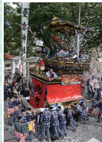
▶尾張横須賀まつりの様子

五穀豊穡や災厄防除などを願って山車を巡行するおまつりです。山車は伝統工芸の粋をこらした彫刻などで飾り付けられ、さまざまなからくり人形が載せられています。市内には尾張横須賀まつりと大田まつりの二つが伝えられていますが、ほかの地区でも山車まつりが行われていた記録が残っています。