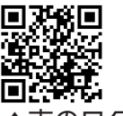
▲市のワクチン特設サイト