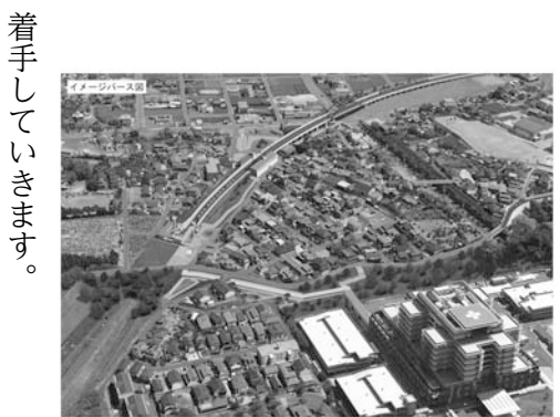
着手してまいります。

●本市の東西を結ぶ主要幹線道路の1つ、養父森岡線と名鉄河和線との立体交差事業及び新駅整備については、先の臨時会で承認された鉄道事業者との協定に基づき、鉄道の仮線工事に着手すると共に、公立西知多総合病院へのアクセス通路や橋りょうの整備工事に