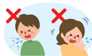
何もせずに咳やくしゃみをする 咳やくしゃみを手でおさえる