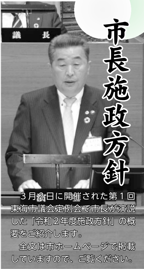
3月2日に開催された第1回東海市議会定例会で市長が演説した「令和2年度施政方針」の概要をご紹介します。 全文は市ホームページで掲載していますので、ご覧ください。