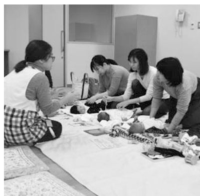
立てるよう研究していきます。

●昨年、障害のある人たちの就労につなげるため、県内では4番目になる民間事業者による農園が加木屋町に開設されました。本市は、市内在住の障害者の優先雇用などを内容にした協定を締結し、市内の多くの障害者の方々が就労されたので、将来にわたって、定着して就労を続けてもらえるよう相談支援を実施し、障害者の皆さんが、自立し、いきがいを持って働き続けていくことができるよう支援し