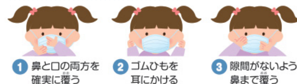
1 鼻と口の両方を確実に覆う 2 ゴムひもを耳にかける 3 隙間がないよう鼻まで覆う