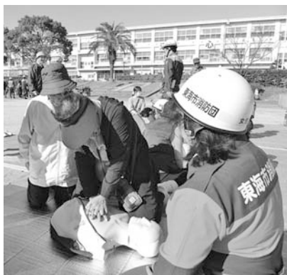
が直ちに駆けつけて救助や支援を行うには限界があり、地域のコミュニティやNPOなどによる共助が大きくなることを認識されました。そのため、大規模災害発生直後から市外の救助者が到着するまでの間、1人でも多くの命を救うための共助機能を強化するため、日本福祉大学と連携して、市内在住の就業していない看護師や保健師など、潜在看護職を対象にした災害支援研修を実施しました。地域に埋もれている力を災害時に発揮してもらえよう、潜在看護職だけではなく、就業していない歯科衛生士や栄養士など、対象を拡大して災害支援研修を実施し、災害発生時の共助システムの構築に結びつく基盤形成に努めていきます。

我が国は、世界の国々が経験したことのない超高齢社会に突入しています。これまでは、60歳で定年になり、その後は余生を過ごすというライフプランが一般的でしたが、長寿化が進み70歳を超えても働き続ける人生100年時代が訪れようとしています。この長寿社会