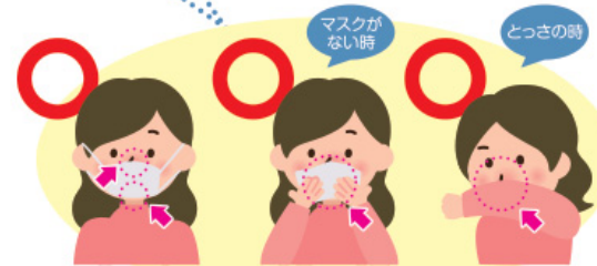
マスクを着用する（口・鼻を覆う） ティッシュ・ハンカチで口・鼻を覆う 袖で口・鼻を覆う