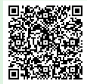
▲ Android 用