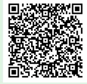
▲ iOS 用

東海ナビは、ごみ分別区分やごみ収集日が簡単に検索できる便利なアプリです。 左のQRコードからダウンロードして、ぜひ、ご活用ください。 詳しくは、ごみの出し方については清掃センターへ、東海ナビについては市役所情報課(3階)へ。