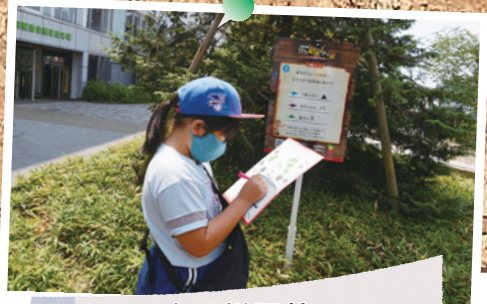
太田川駅前 リアル謎解きゲームⅢ

芸術劇場で「子どものオーケストラ第2回定期演奏会」が開催されました。日頃の練習成果を、堂々とした演奏で披露した団員に、会場から大きな拍手が送られました。