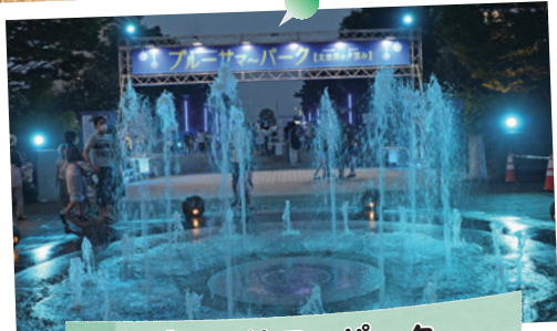
ブルーサマーパーク

どんでん広場などで「ブルーサマーパーク」が開催されました。夕涼みライトアップ演出が行われた会場では、線香花火の一斉点火の催しなどが行われ、参加者は花火の光などを楽しんでいました。