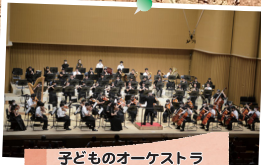
子どものオーケストラ 第2回定期演奏会

太田川駅東側歩道で「遊べる太田川」が開催されました。レゴブロックで遊ぶコーナーやリゾート気分を味わえるハンモックに乗れるコーナーなど、多くの親子が参加していました。