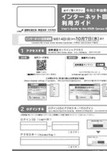
▲インターネット回答利用ガイド

9月14日(月)から国勢調査員が調査書類を配布します。調査書類の中には右のインターネット回答利用ガイドが入っていますので、お手持ちのパソコンやスマートフォンなどで回答をお願いします。