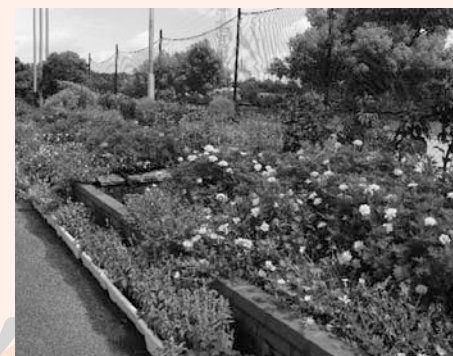
保育園・学校花壇の部 最優秀賞 三ツ池小学校の花壇