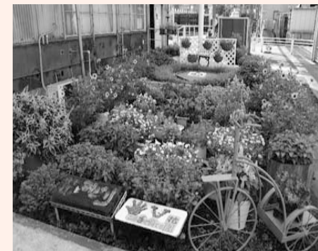
共同花壇の部 最優秀賞 愛知製鋼工機課の花壇

10月11日～20日 秋の安全なまちづくり県民運動 秋が深まるにつれ、日没時刻が早くなります。子どもや女性が犯罪被害に遭わないように、地域ぐるみで見守っていきましょう。 ● 侵入盗 空き巣と「侵入盗」と聞くと、留守にしている間に侵入して金品を盗む、「空き巣」をイメージされる方が多いのではないのでしょうか。 実際に、この「空き巣」は侵入盗の手口の中では最も多く発生していますが、そのほかに家人が在宅中に侵入する「忍込み（夜間、家人の就寝時に侵入する手口）」「居空き（家人が在宅中に気付かれないように侵入する手口）」といった手口も発生しています。