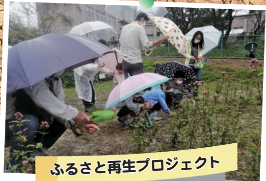
ふるさと再生プロジェクト

農業センターのリニューアルに向けた取り組みの1つとして、施設野菜試験栽培温室が完成しました。温室では、9月からトマトの養液栽培をはじめ、3月に収穫する予定です。