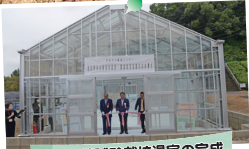
施設野菜試験栽培温室の完成

農業センターのリニューアルに向けた取り組みの1つとして、施設野菜試験栽培温室が完成しました。温室では、9月からトマトの養液栽培をはじめ、3月に収穫する予定です。