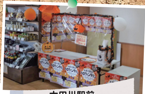
太田川駅前 ハロウィンタウン

「カメラ講師同行！工場夜景遊覧クルーズコース」が開催されました。地元のカメラ屋さんから工場夜景の写真撮影の仕方を学びました。