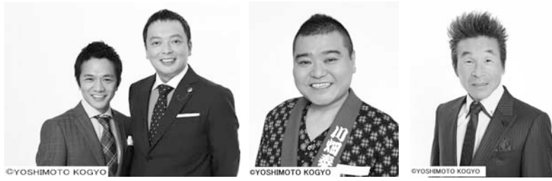
▲中川家 ▲川畑泰史さん ▲間 寛平さん

この冬も芸術劇場が大笑いの渦に巻き込まれること間違いなし。毎年好評の漫才やコントのバラエティショーと吉