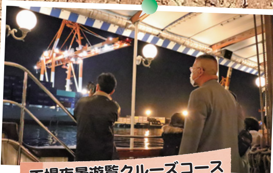
工場夜景遊覧クルーズコース

加木屋緑地で「ふるさと再生プロジェクト」が開催されました。当日は雨でしたが、参加者の皆さんは、アサギマダラの観察や春の七草の植栽などふるさとの自然に親しみました。