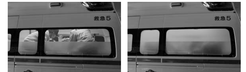
▲ワンタッチ操作で車内の様子が外から見えなくなるようにできるブラインドフィルム（左が操作前・右が操作後）

これらの機能により、新型コロナウイルス感染者搬送時の感染リスクを大幅に低減する効果が期待されます。