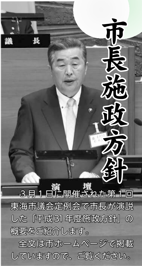
3月1日に開催された第1回東海市議会定例会で市長が演説した「平成31年度施政方針」の概要をご紹介します。全文は市ホームページで掲載していますので、ご覧ください。