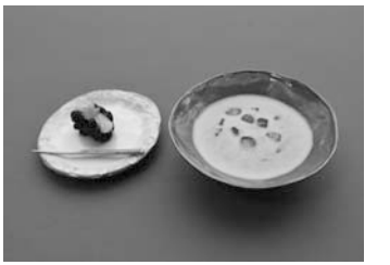
ろ 嚶鳴庵 ●料金 300円(茶菓子付き)

●とき 4月8日(月) ◎午前の部：午前10時～正午 ◎午後の部：午後1時～3時 ●ところ 観光物産プラザ ●内容 織りの布をマール染様に染め、好きな形にアレンジして厚手のトートバッグを飾り付ける ●定員 各6人(先着順) ●参加料 1人千500円(材料費を含む) ●講師 アトリエiroiro ●持ち物 エプロン ●申し込み 観光物産プラザへ 詳しくは、申込先へ。