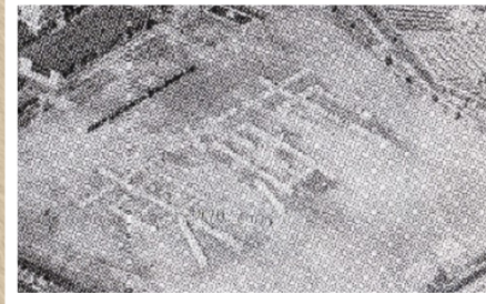
◀上野中学校の生徒による人文字