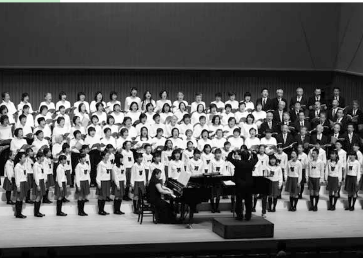
総勢150人を超す迫力の歌声を披露