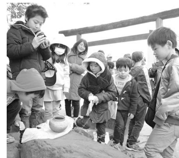
初めて見る古代の土器に興味津々

3月23日(土)、東海市の歴史や文化財に関心を持ってもらうことと、文化財保護意識の向上を図るため、大田町周辺の文化財の解説を聞きながら歩いて巡る「発見!わが町探検隊」が開催されました。