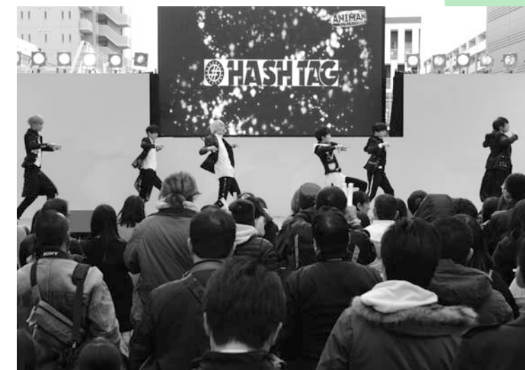
ステージに釘付けの来場者の皆さん

また、大田まつりの山車や痛車の展示もあり、駅前にはさまざまな文化で賑わいました。