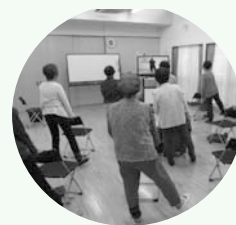
グループ活動の様子

グループ活動支援を受けるためには、グループ登録が必要です。登録をしていただくとDVDをお渡しすることなどができます。