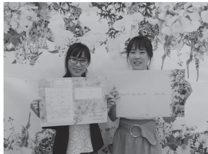
フォトスポットの前でぜひ、記念撮影してみてください