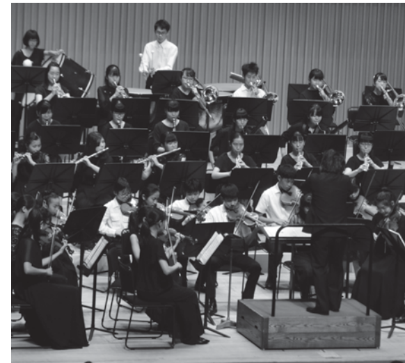
迫力ある生演奏に大きな拍手がおくられました

8月25日(日)、平成28年2月に発足し、練習を積んできた「東海市子どものオーケストラ」が、第1回定期演奏会を芸術劇場で行いました。