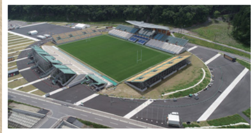
◀ 釜石鶴住居 復興スタジアム