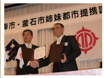
◀ 姉妹都市提携調印式 (平成19年)

東海市は、4月1日に市制50周年を迎えました。「東海市タイムトラベル」は、東海市誕生から50年間のまちの歴史や、市制50周年記念事業などを紹介していきます。詳しくは、市役所企画政策課(3階)へ。