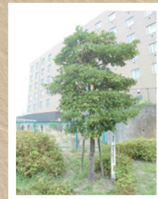
◀ 上野台公園の「タブノキ」

ぜひ、一度足を運んでいただき、釜石市との交流の長さを感じてみてはいかがでしょうか。