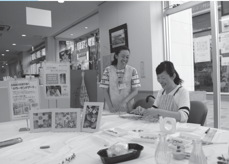
和やかな雰囲気ワークショップの様子