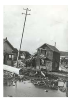
▲当時の様子

本市において、死者・行方不明者143人を出し、甚大な被害をもたらした伊勢湾台風から今年で60年になります。台風の恐ろしさや、今後の災害への備えの大切さを子どもたちに伝えるため、伊勢湾台風60年防災ミュージカルを上演します。