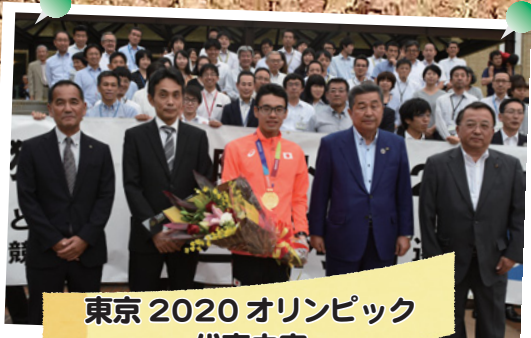
東京2020オリンピック 代表内定

11月1日（金）から市内の8店舗で、本市の魅力がグッと詰まった「ご当地焼きそば・トマセン焼きそば」のスタートアップキャンペーンを行います。 「トマト・えびせんべい・カゴメソース・たまねぎ」を使ったトマセン焼きそばは、見た目も食感も新感覚です。各店舗先着70人にオリジナルソースのプレゼントもあります。詳しくは、市役所商工労政課（5階）または東海市観光協会ホームページへ。