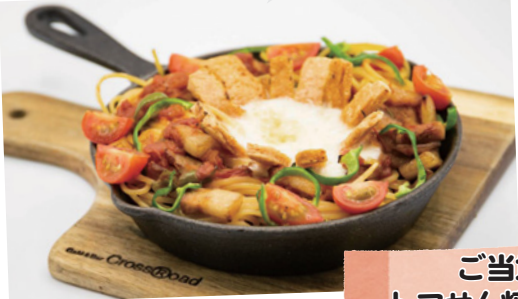
ご当地グルメ トマセン焼きそばが登場