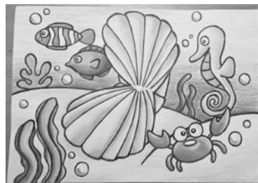
▲ベビーアートフォト