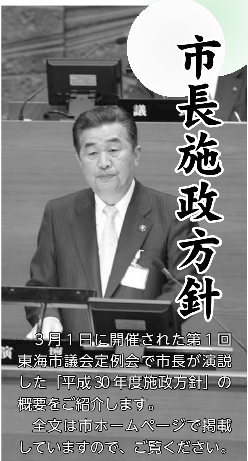
3月1日に開催された第1回東海市議会定例会で市長が演説した「平成30年度施政方針」の概要をご紹介します。