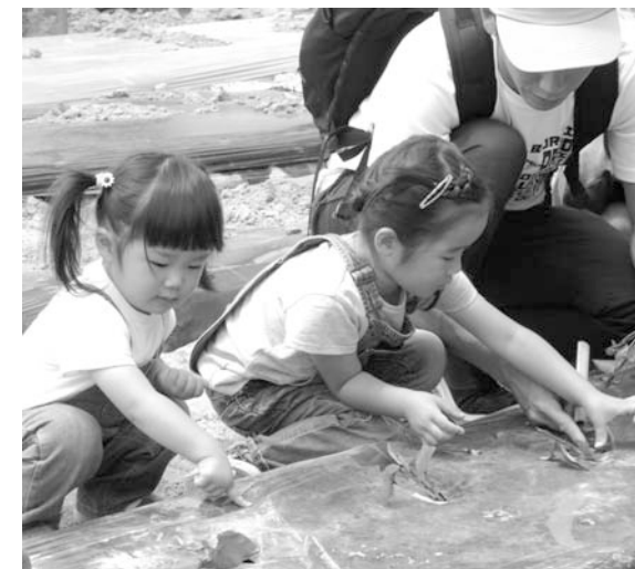
サツマイモの植え付けを楽しむ親子

5月20日(日)、農業センターで「親子農業体験教室」が開催され、28組70人の親子が参加しました。この教室は、土に親しみ、農業の面白さや自然の良さを親子で体験してもらうことを目的に開かれました。