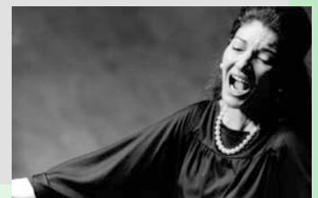
▼マリア・カラス

⑦ 公序良俗に反しないもの、被写体の肖像権・管理・所有権に問題が生じないもの。作品の主たる被写体になっている人物からの苦情などの責任は、著作者（撮影者）が負うもの