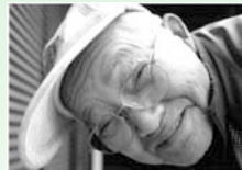
▲91歳笑顔がいちばん (昨年度の出品作品)