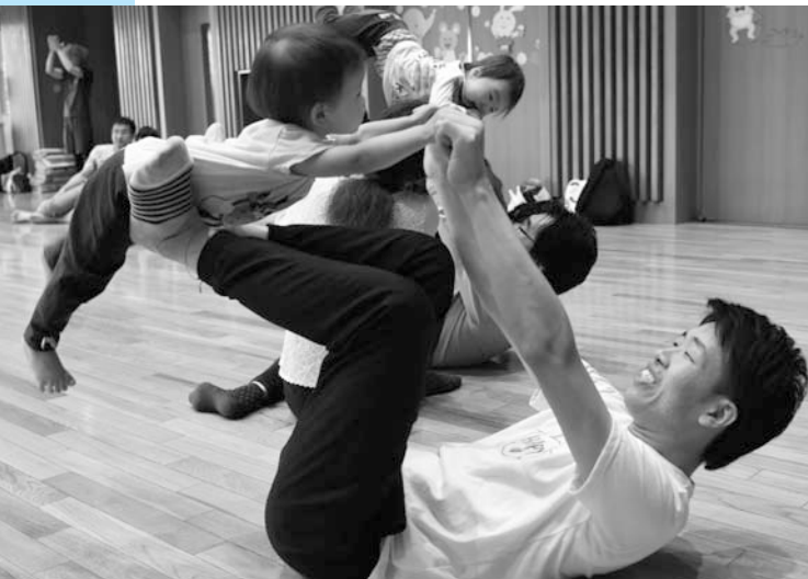
身体を動かし楽しいひと時を過ごす親子