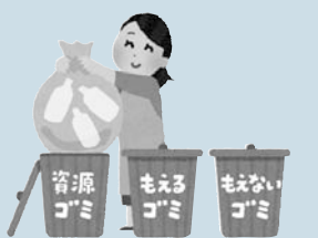
資源ごみ もえるごみ もえないごみ