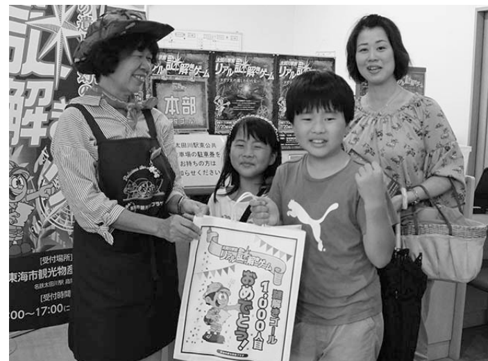
参加者 1,000 人目となり大喜び

このイベントは、初級・上級コースともに10月8日(月)まで開催中で、謎解きをクリアするとまちづくり応援大使やへいしゅうくんの記念グッズがもらえます。ぜひ、この機会に太田川駅に足を運んでみてください。