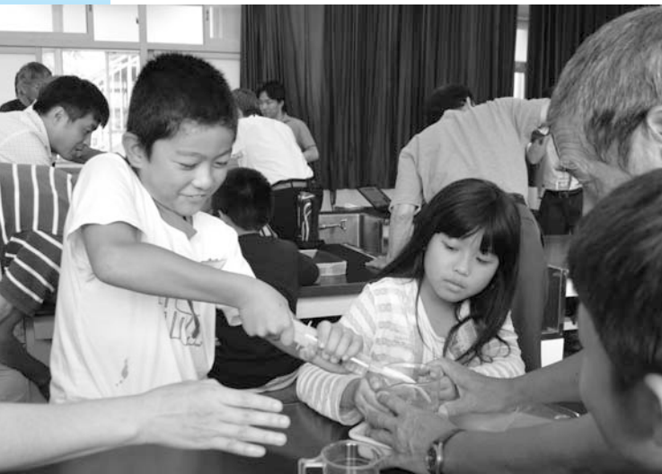
色水が透明な水に!