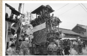
▲昭和53年の大田まつり