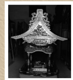
▲精巧な彫刻が施された獅子屋形

高横須賀町の諏訪神社の祭りでは、かつて「獅子屋形」というものが使われていました。一時は他所へ売られましたが、後に買い戻されて秋の祭りの際に展示されています。「獅子屋形」は名古屋周辺でかつて盛んに作られた祭り用具で、長持ちという台に乗せてお囃子とともに町中を練り歩きました。市内ではほとんど残っていない貴重なものです。