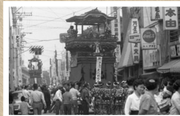
▲昭和44年の横須賀まつり

31年度に市制50周年を迎える東海市。「東海市タイムトラベル」は、東海市誕生から50年間のまちの歴史や、市制50周年記念事業などを紹介していきます。詳しくは、市役所企画政策課(3階)へ。