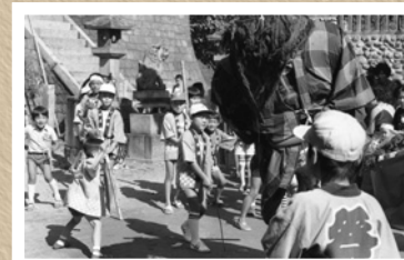
▲昭和46年の猩々メッタ