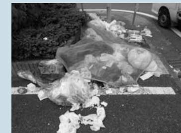
▲散乱したごみの様子

ごみ集積場所は地域の管理している方が困ることのないよう、ごみ出しのルールを守りましょう。