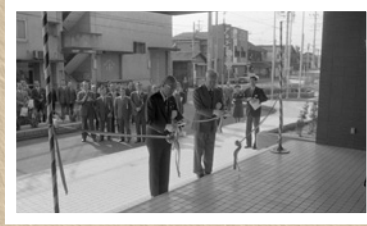
▲昭和 55 年文化センター開館