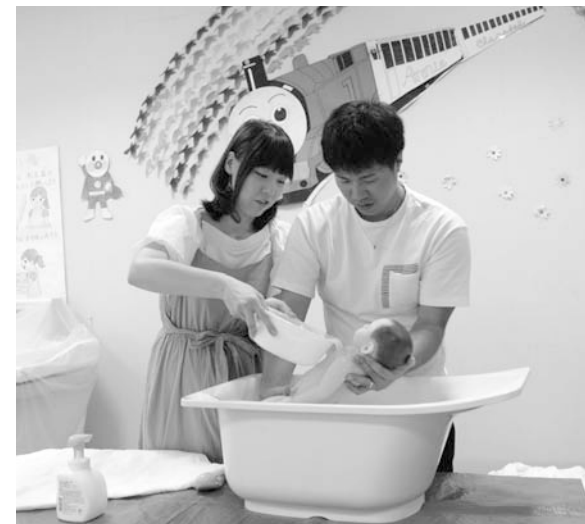
沐浴中に話しかけてあげるのがポイント

9月8日(土)、しあわせ村保健福祉センターで両親学級が開催されました。両親学級は、初めての赤ちゃんを授かったお母さんとお父さんのためのクラスです。当日は、沐浴体験・妊婦体験、出産時にお母さんと赤ちゃんの身体に起きていることについての講義などがありました。