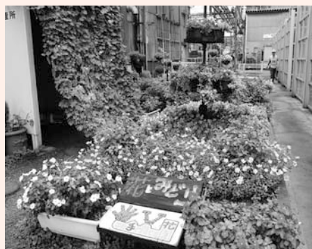
共同花壇の部 最優秀賞 愛知製鋼工機課の花壇