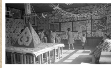
▲昭和 44 年東海まつり (横須賀小学校会場)