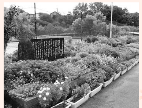
保育園・学校花壇の部 最優秀賞 三ツ池小学校の花壇