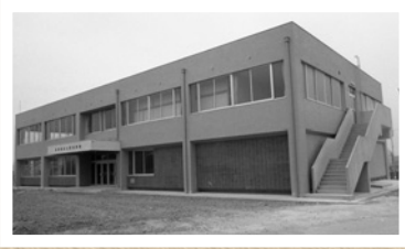
▲昭和 45 年上野公民館開館

31 年度に市制 50 周年を迎える東海市。「東海市タイムトラベル」は、東海市誕生から 50 年間のまちの歴史や、市制 50 周年記念事業などを紹介していきます。詳しくは、市役所企画政策課(3 階)へ。