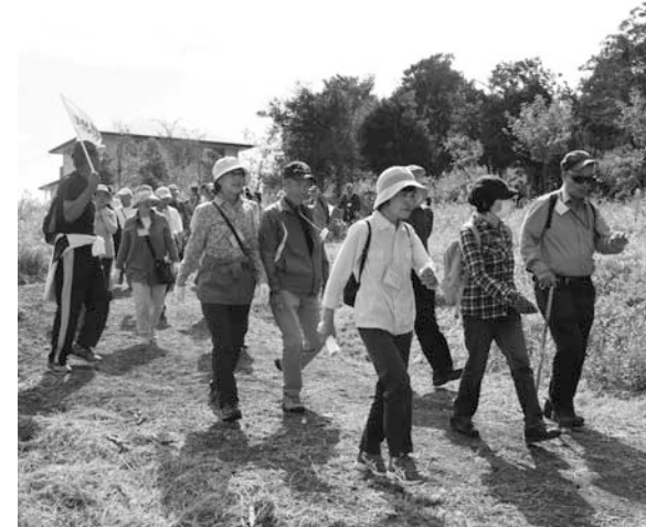
景色を楽しみながら歩くことがポイント