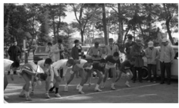
▲昭和 45 年第 1 回市民マラソン

31 年度に市制 50 周年を迎える東海市。「東海市タイムトラベル」は、東海市誕生から 50 年間のまちの歴史や、市制 50 周年記念事業などを紹介していきます。詳しくは、市役所企画政策課（3 階）へ。