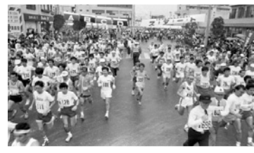
▲昭和 60 年第 1 回東海シティマラソン