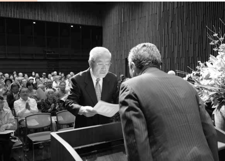
団体表彰は加木屋南連合会の南長寿会に