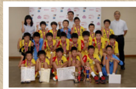
▲22 年度全国大会優勝小学女子（写真上）と 25 年度全国大会優勝小学男子