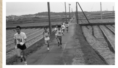
▲昭和 60 年のどかな田園の中を走るランナー（シティマラソン）