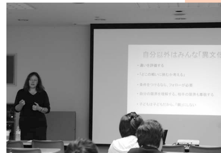
一人ひとりが違って当たり前