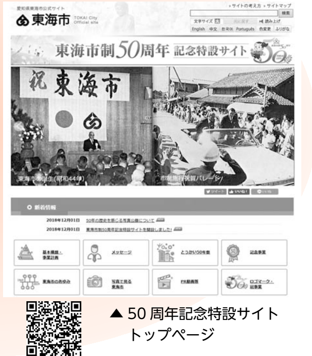
▲ 50周年記念特設サイト トップページ