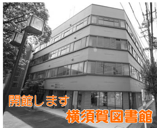
開館します 横須賀図書館