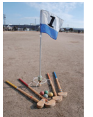
▲グラウンド・ゴルフの道具