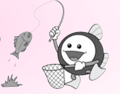
下水道マスコットキャラクター「スイスイ」