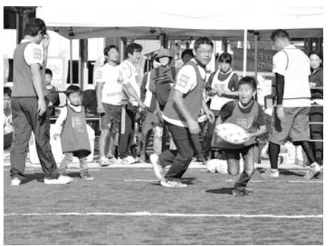
▲ラグビーワールドカップ2019TMの釜石開催に向けて機運が高まっています