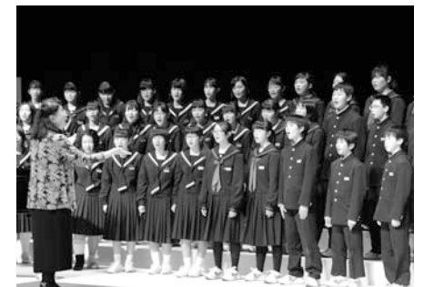
▲市制施行80周年記念式典で披露された加木屋中学校と釜石東中学校の合同合唱

29年度は、釜石市制施行80周年となる記念の年であり、また、多くの公共施設が完成した年でもありました。唐丹地区や鶴住居地区の小中学校の新校舎完成を始め、東部地区には、「魚のまち」復活の中核となる釜石市魚市場が整備され、浜の活気が戻ってきました。29年12月には、被災した旧市民文化会館に替わる釜石市民ホールTREETOが開館。2月9日には