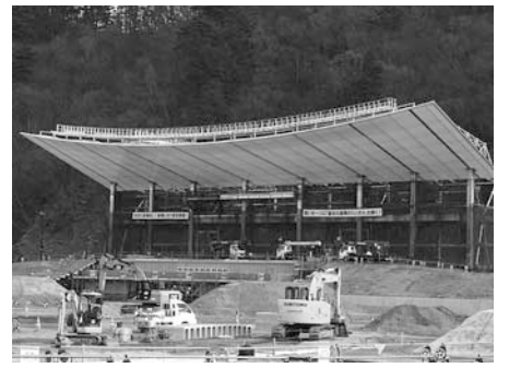
▲釜石鶴住居復興スタジアム(仮称)も着々と建設が進んでいます