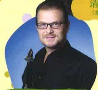
ロバート・ボルシヨス (クラリネット・名フィル首席奏者)

2023年1月14日(土) 11:00開演 10:00開場 12:00終演予定 東海市芸術劇場 大ホール 名鉄「太田川」駅南改札口すぐ