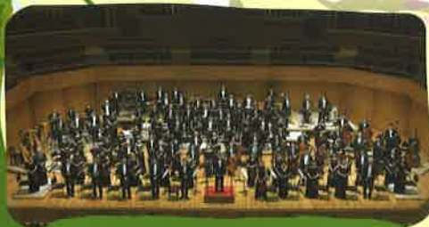
名古屋フィルハーモニー交響楽団 (管弦楽)